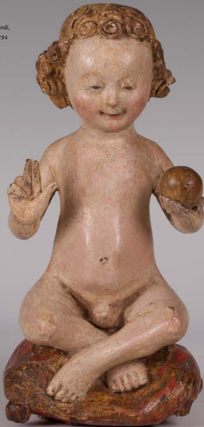
Zittend Christuskind als Salvator Mundi, Mechelen(?), ca. 1500-1510, RMCC b194