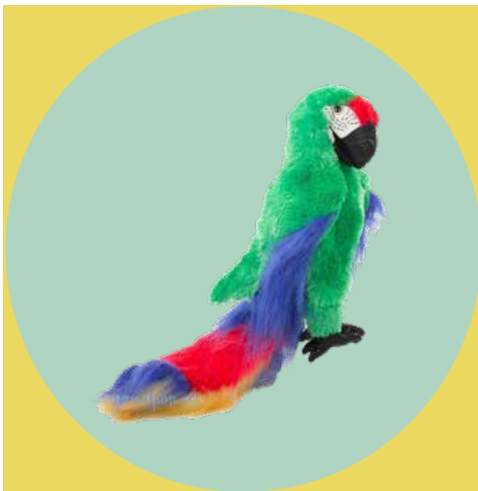
Ara de papegaai