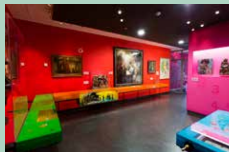
De tentoonstelling in Museum Catharijneconvent