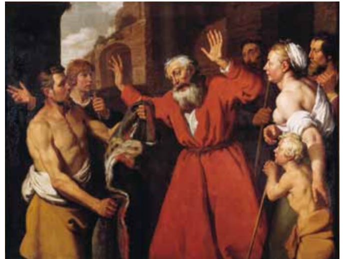
Jacob herkennt het bebloede kled van Jozef, Lambert Jacobsz, 1630, olieverf op doek, 160 x 207 cm.

In de zomer presenteerde het museum de volle glorie van de eigen kerncollectie van religieuze schilderkunst uit de vijftiende t/m de zeventiende eeuw. Enkele van deze schilderijen leidden lang een verborgen bestaan in het depot. Te zien waren onder meer werken van Rembrandt, Abraham Bloemaert, Jan van Bijlert en Frans Hals. Wij vertelden er de verborgen verhalen bij. Verhalen uit de bijbel die op de werken te zien zijn, maar ook de verhalen over de schilderijen zelf, wat er zich onder de verfhuid afspeelt en dankzij fascinerende schildertechnieken tot stand kwam. We legden uit hoe de schilderijen hun verhaal vertellen: dramatische, spannende, mooie of