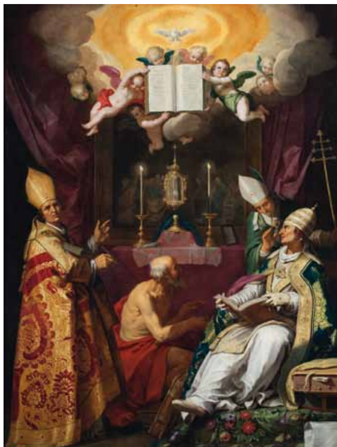
Vier kerkvaders: Augustinus, Hieronymus, Gregorius en Ambrosius, Abraham Bloemaert, 1632, olieverf op doek, 206 x 155 cm

Met de aankoop van De vier kerkvaders (1632) van Abraham Bloemaert voegde Museum Catharijneconvent in 2010 een belangrijk kunstwerk toe aan het Nederlands openbaar kunstbezit. Het is immers één van de meest expliciet katholieke schilderijen uit de Nederlandse zeventiende eeuwse schilderkunst. Door de ondergrondse katholieke gemeenschap werd het ingezet voor religieuze propaganda in de door protestanten gedomineerde samenleving. Omdat Bloemaert werd begraven in de Catharinakerk naast het museum, vond het werk letterlijk zijn weg terug naar de schilder. Bovendien vertoont de mantel van één van de kerkvaders op het schilderij een opvallende gelijkenis met een topstuk uit de collectie van Museum Catharijneconvent, de vijftiende eeuwse bisschopsmantel van David van Bourgondië. Dat geldt ook voor een prent die als voorbeeld diende voor Bloemaerts compositie. Na bijna 400 jaar zijn deze voorbeelden herenigd met het resultaat in één museale collectie. De vier kerkvaders heeft zich bewezen als de schakel die een prachtig verhaal compleet maakte. Om die reden werd het schilderij in 2011 genomineerd in het AVRO-kunstprogramma Hollandse Nieuwe voor het predikaat beste aankoop voor het Nederlands openbaar kunstbezit uit het afgelopen jaar.