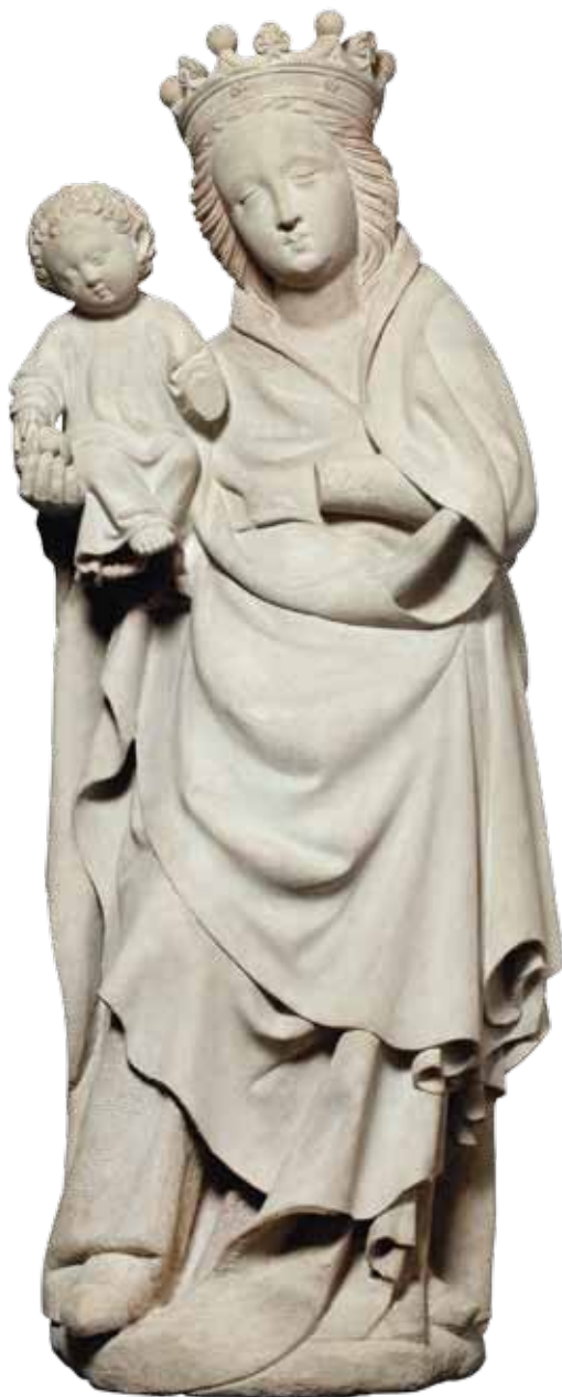
Maria met kind op rechterarm, Westfalen, 1425-1434, zandsteen en verf, 120 x 42 x 28 cm.

Van een ingetogen schoonheid is de zandstenen Maria met kind . Ze staat, weer schoon, nu bij de ingang naar de Schatkamer.