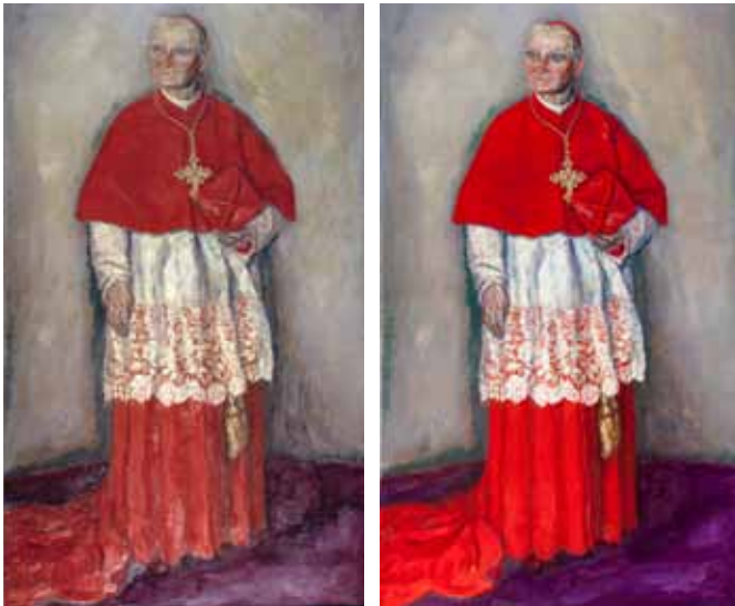
Portret van kardinaal Willem van Rossum, Jan Sluijters, 1927, olieverf op doek, 206 x 120 cm. Voor en na restauratie.