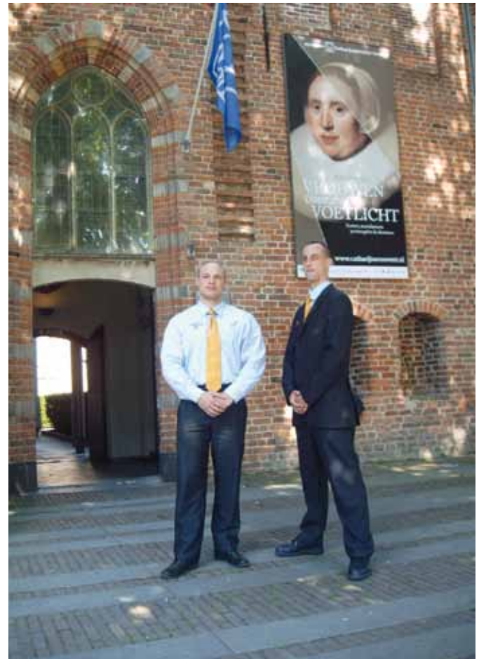
De nieuwe bedrijfskleding

Het Huis van Sinterklaas was een bijzonder evenement, educatief en wervend tegelijk. De toegang was het eerste jaar gratis, mensen konden reserveren en we waren helemaal uitverkocht. Dankzij Het Huis is het educatief bezoek verdubbeld. Bovendien ontvingen we veel mensen in huis die voor de eerste keer in het museum waren, en zo enthousiast dat ze zeker terug wilden komen.