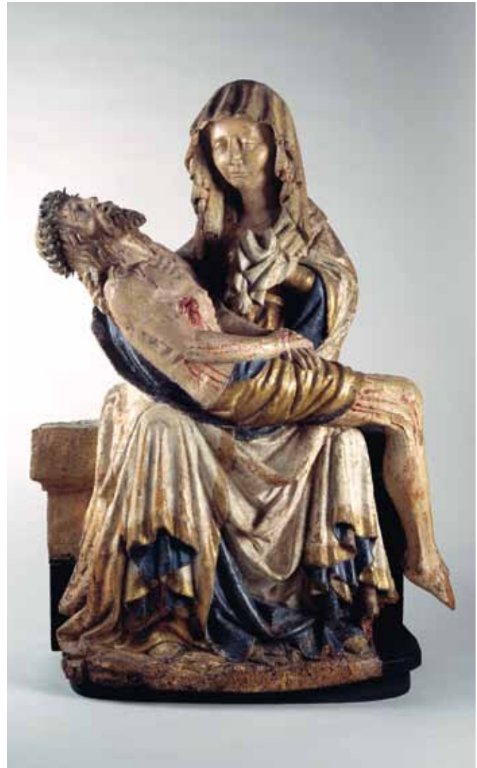
Piëta, Bohemen of Zuid-Duitsland, eerste kwart 15de eeuw. Linden-hout met polychromie, 100 x 67 x 32 cm. Herkomst: erven Guttman (2011), aangekocht met steun van het BankGiro Loterij Aankoopfonds van de Vereniging Rembrandt.

De jaarlijkse tentoonstelling over kerst is inmiddels een ware publiekstrekker voor Museum Catharijneconvent. Het is dan ook niet vreemd dat in 2011 uitgebreid aandacht is geschonken aan en werd geïnvesteerd in de staat van deze collectie. De Tiroler kerstgroep werd gerestaureerd en schitterde in december in de presentatie Zin in kerst . Verder werden vier kerststalfiguren uit eigen collectie gerestaureerd.