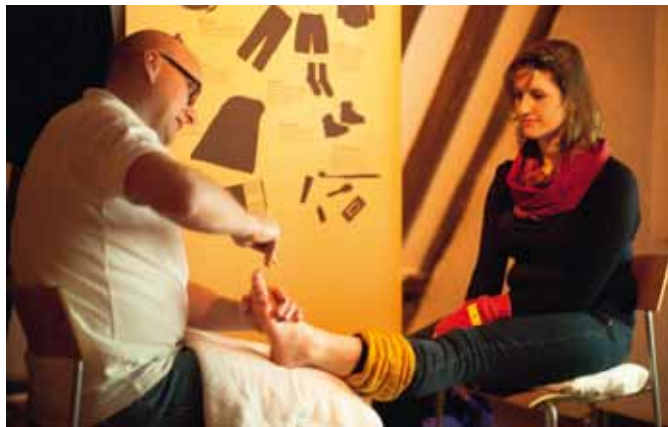
Voetmassages tijdens Museumnacht 2011