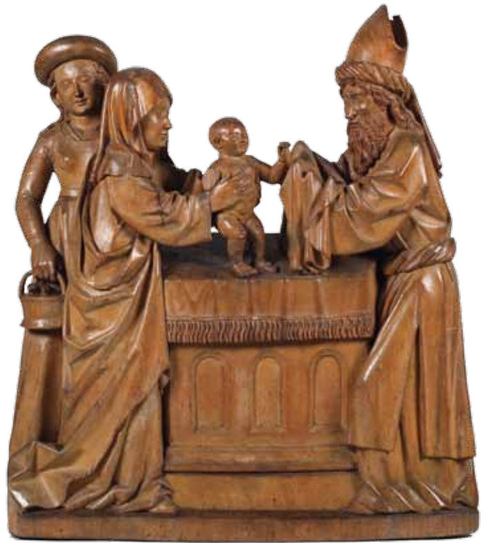
Opdracht in de tempel , Noord-Nederland, 1465-1479, hout en verf, 80 x 71 x 19 cm

Er zijn in nauwere en ruimere kringen rond Museum Catharijneconvent velen die zich inzetten voor het museum, omdat zij de collecties zien als een cadeau en hun dankbaarheid daarvoor op de een of andere manier tot uitdrukking willen brengen – de vrienden, de vrijwilligers, de donateurs en de sponsors. Zij participeren ieder op hun eigen manier in het museum, voelen zich erbij betrokken. En binnen die gemeenschap van betrokkenen heerst een zeker gevoel van verbondenheid – verbondenheid die ook kenmerkend is voor de bijzondere momenten die wij aan het slot van dit hoofdstuk de revue laten passeren.