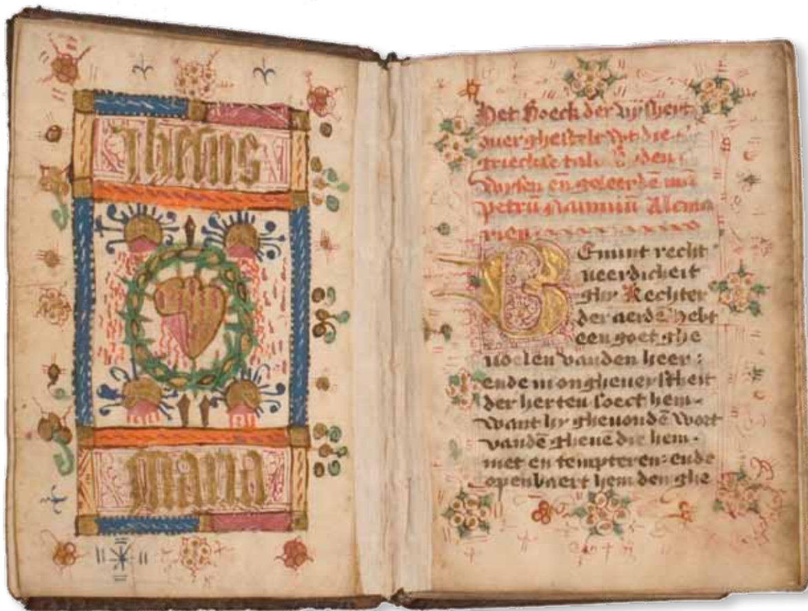
Boec der wijsheid, Petrus Nannius (auteur), Zaltbommel, 1555, perkament, 18 x 13 x 3 cm, f. 2v-3r

wij invulling aan onze wetenschappelijke kernfunctie, in de hoop dat studie en educatie gepaard blijven gaan met genoe- gen , drie andere sleutelwoorden uit de statuten.