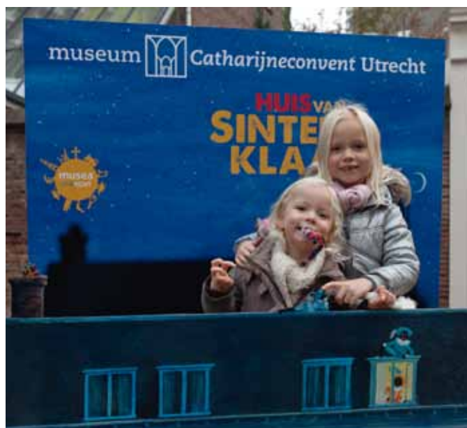
Bezoekers van Het Huis van Sinterklaas

“ De ontvangst door erg lieve Pieten, de kinderen mochten zich bekwamen in het werpen van kadootjes in de schoorsteen, en... de ontmoeting met De Goedheiligman zelf! Wat een fijne Sint, rustige man, prachtig om te zien, fijne spreekstem en met veel aandacht voor de vragen van de kindjes... Echt het warme Sintgevoel in een kamer vol velours, lieve pieten en jeugdsentiment. Laat het 'heerlijk avondje' nu maar komen! :-) Bedankt en... tot volgend jaar! ”