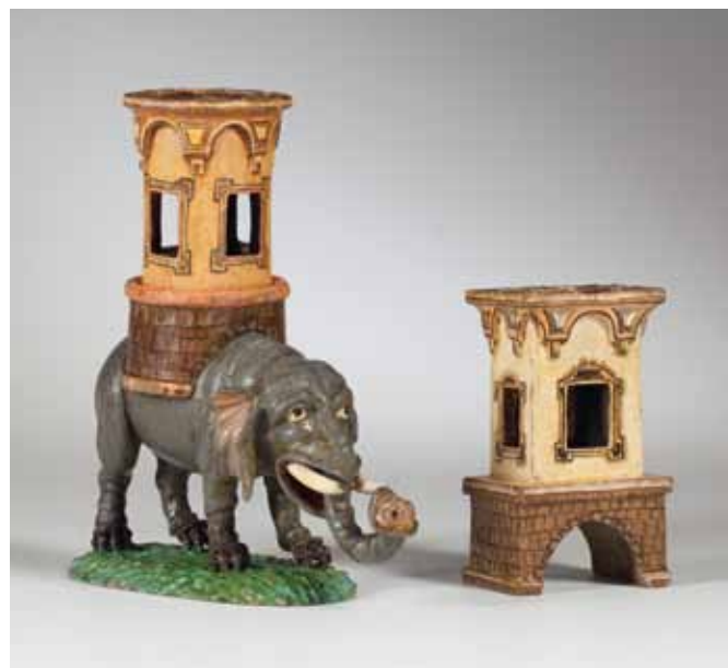
Het olifantje uit de Tiroler kerstgroep

Zin in kerst trok daardoor bekend en nieuw publiek.