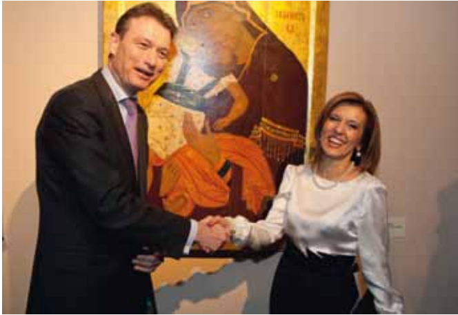
Staatssecretaris Cultuur Halbe Zijlstra en Minister van Cultuur van de Republiek van Macedonië H.E. Elizabeta Kanceska-Milevska voor ikoon De Moeder Gods van de Tederheid Pelagonitissa , “die een reputatie geniet vergelijkbaar met de Nachtwacht”