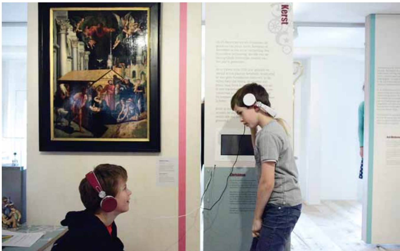
Feest! In de stad in het Bijbels Museum in Amsterdam