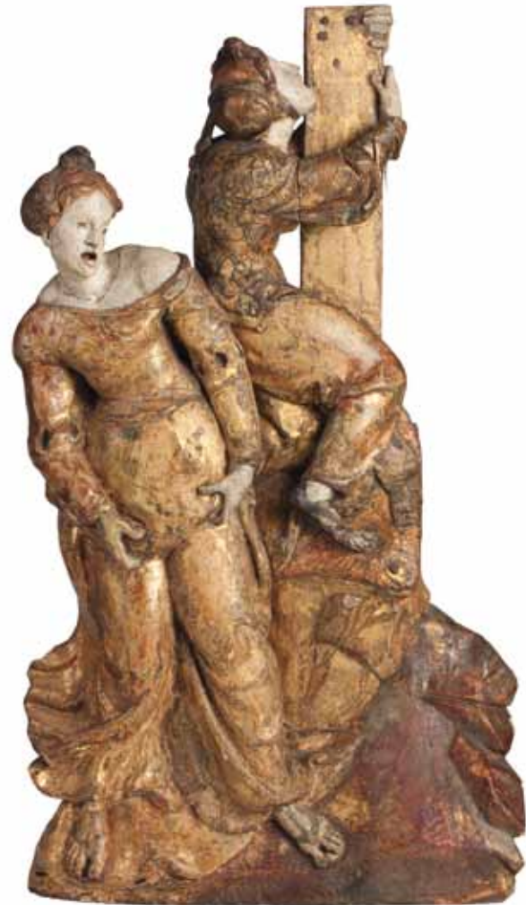
Twee treurende vrouwen onder het kruis, Antwerpen, ca. 1540

Verwervingen vinden plaats door aankoop, bruikleen of schenking. Alle verwervingen worden getoetst aan het belang voor de Collectie Nederland en de eigen collectie. Van belang is onder meer dat er geen vergelijkbaar stuk in het museum bestaat, of dat het object van betere kwaliteit is dan een vergelijkbaar voorwerp. Een ander criterium is de kans dat het voorwerp wordt getoond in vaste of tijdelijke exposities, maar het object kan ook opgenomen worden omdat het een belangrijke documentatie- of archief functie heeft. Verder is van belang dat het object zich in goede staat bevindt, of dat conservering en/of restauratie geen buitensporige inspanning vraagt. Belangrijke verwervingen in 2013 waren een houten sculptuur van Jezus op de ezel (zie ook hoofdstuk 2), een albasten