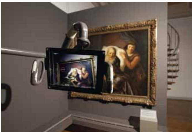
De iPad met applicatie voor Govert Flincks Isaäk zegent Jacob

Met infraroodtechnieken hebben ze ontdekt dat deze tekst over een altaarstuk is geschilderd. Die afbeelding hebben we over de tekst heen geprojecteerd, zodat je het oude schilderij als het ware naar voren zag komen.'