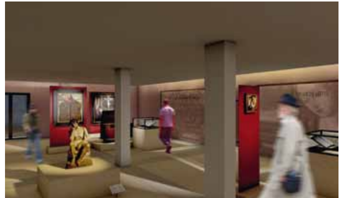
Ontwerptekeningen Kinkorn van de nieuwe presentatieruimte