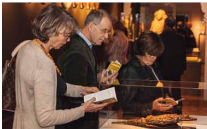
Bezoekers op de tentoonstelling Ontsnapt aan de Beeldenstorm