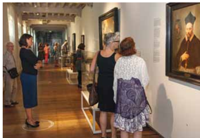
Bezoekers op de tentoonstelling Vormen van Verdraagzaamheid