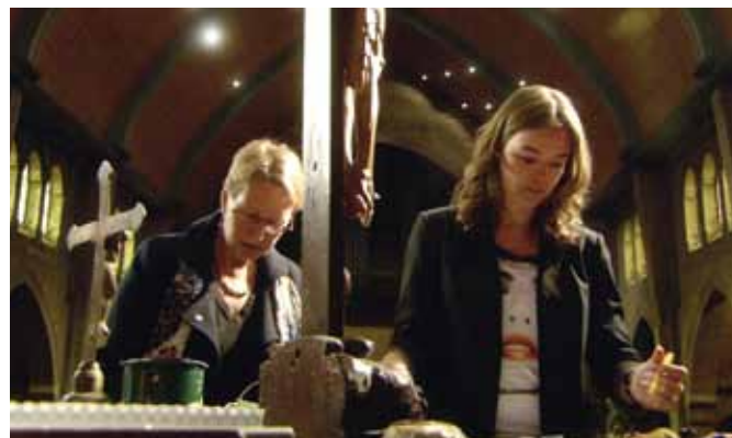
Medewerkers van de afdeling Erfgoed in Kerken en Kloosters brengen de collectie in kaart van een rooms-katholieke kerk.