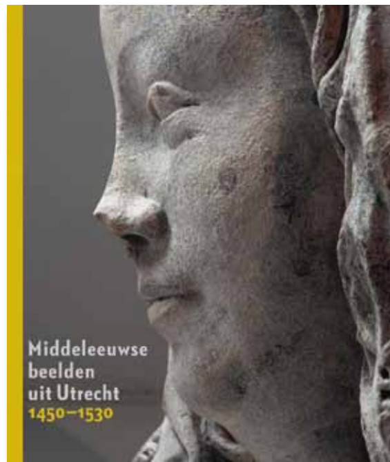
Publicatie bij de tentoonstelling Ontsnapt aan de Beeldenstorm

Daarnaast publiceerde de inhoudelijke staf boeken en artikelen in externe tijdschriften. Er verschenen 28 artikelen van de inhoudelijke staf in het museumtijdschrift Catharijne . Voor al deze publicaties en voor publicaties van derden, nationaal