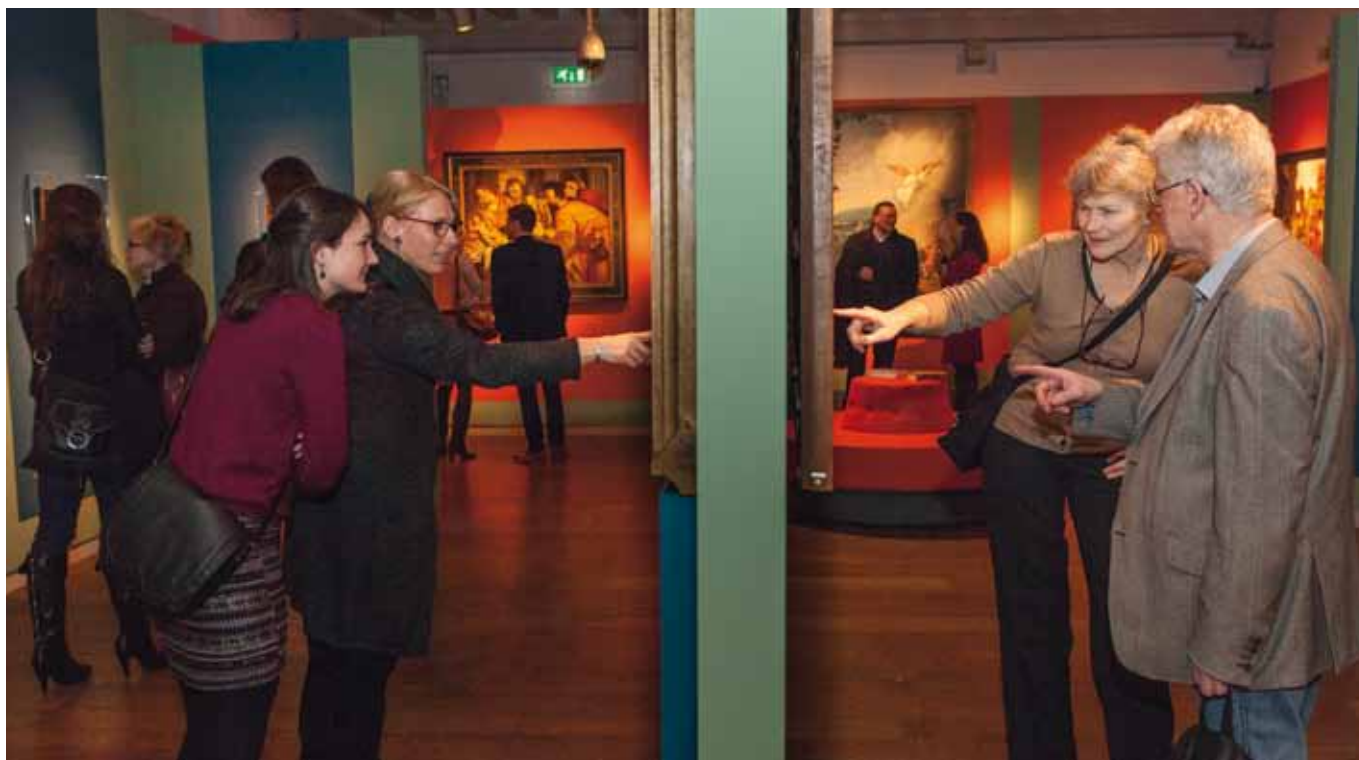
Bezoekers op de tentoonstelling Thuis in de Bijbel

door het publiek wordt er nog te weinig gebruik van gemaakt. Verder gaan we bekijken hoe we alle platforms die we nu al in de lucht houden (o.a. religieusergoed.nl, catharijneverhalen.nl, catharijneconvent.nl en feestweetwatjeviert.nl) meer onderlinge samenhang kunnen geven.'