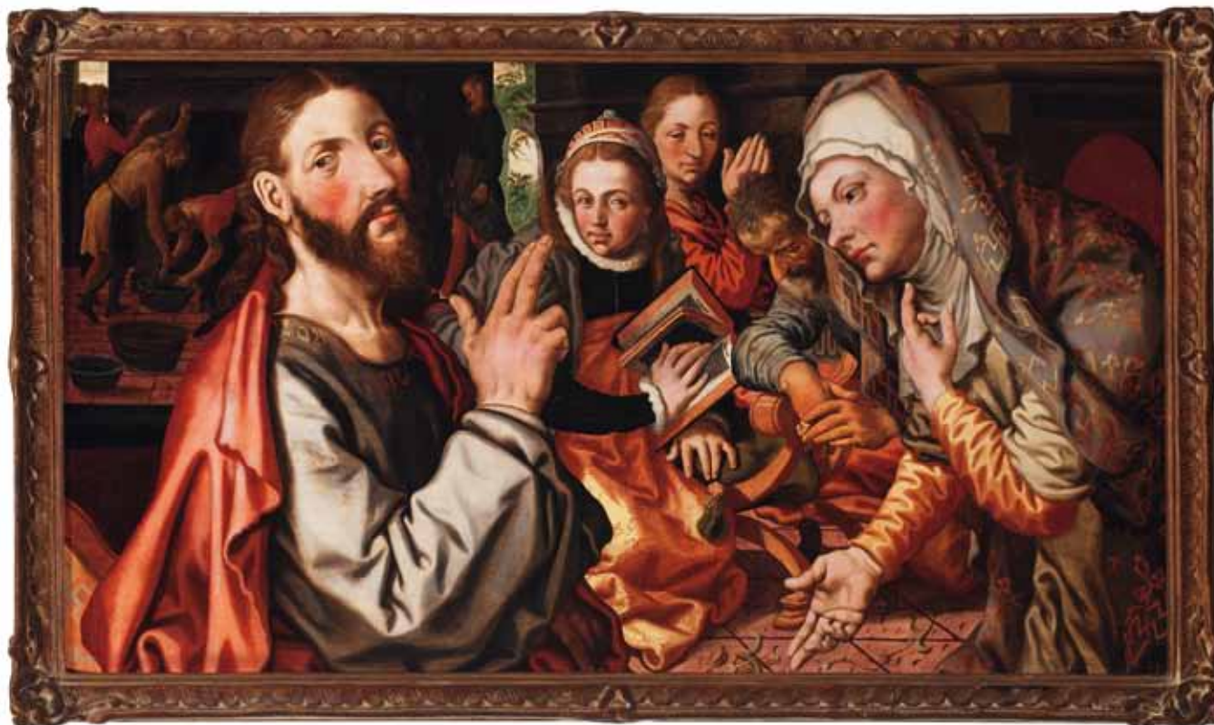
Jezus in het huis van Martha en Maria, Pieter Aertsen, ca. 1555

Merovingisch reliekschrijn en een aantal middeleeuwse tekstfragmenten gingen naar de tentoonstelling CREDO · Christianisierung Europas im Mittelalter in het Diözesanmuseum te Paderborn. Voor De kunst van het opvoeden in het Dordrechts Museum stelden we twee schilderijen beschikbaar. Een schildering en prent gingen naar de tentoonstelling 450 Jahre Heidelberger Katechismus in Heidelberg. Twee middeleeuwse panelen waren te zien in de Koninklijke Musea voor Schone Kunsten van België (Brussel) op De erfenis van Rogier van der Weyden. Schilderkunst in Brussel 1450-1520 . In Musée international de la Réforme in Genève zijn twee spotschilderijen uit de collectie beschikbaar gesteld voor Hell or paradise. Visual polemics in the 16th, 17th and 18th centuries . Vier schilderijen gingen naar Deutsches Historisches Museum in Berlijn voor de tentoonstelling Leben nach Luther. Eine Kulturgeschichte des evangelischen Pfarrhauses . 35 middeleeuwse beelden gingen naar de