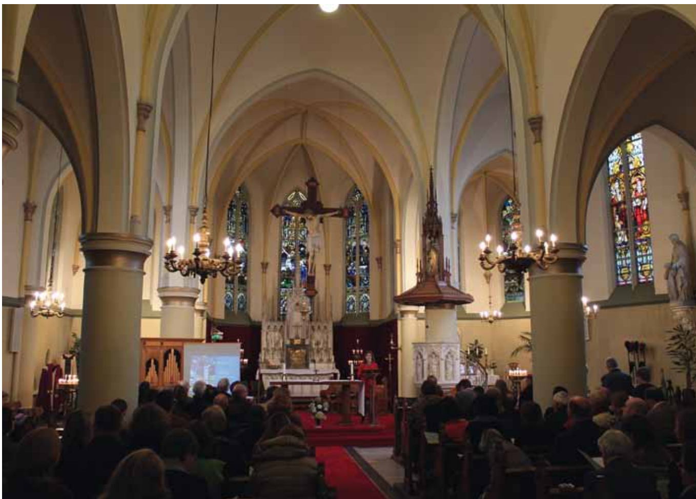
Op de tweede dag van het seminar on Movable Religious Heritage vond er een werkbijeenkomst plaats in de Augustinuskerk in Amsterdam

en internationaal, leverde het museum hoogwaardig beeldmateriaal van objecten uit de collectie.