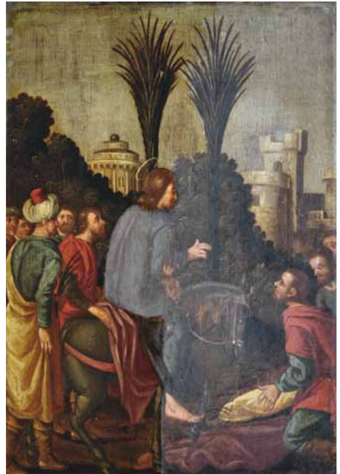
Intocht van Christus in Jeruzalem, tweede kwart zeventiende eeuw. Halverwege de vernisafname (rechts is de vernis verwijderd)