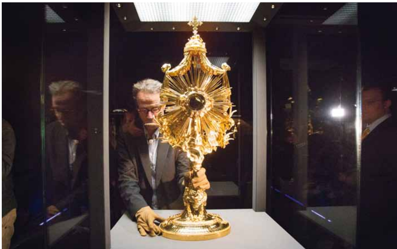
Het terugplaatsen van de monstrans

prettig en veilig, en wij niet alleen; ook de bezoekers voor wie we ons huis elke dag openstellen om te genieten van al het mooie dat we hier mogen laten zien. Toen ik het hoorde schrok ik natuurlijk, maar mijn schrik was nog groter toen ik ter plaatse zag met welk enorm geweld de roof geperd was gegaan.'