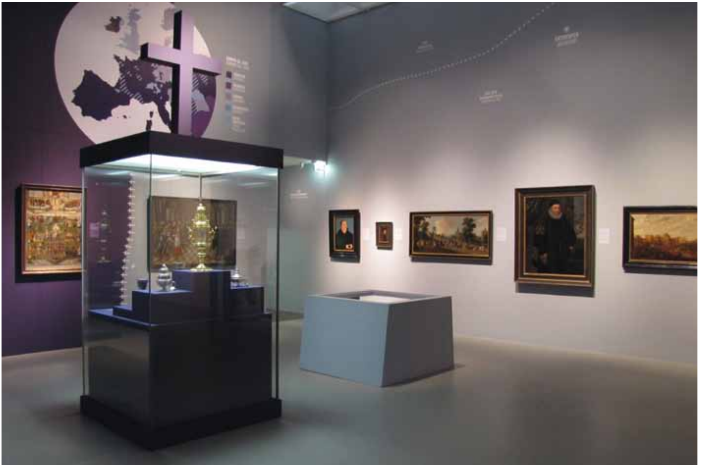
Kunstobjecten uit onze collectie op de tentoonstelling Vrede van Utrecht in het Centraal Museum (o.a. het portret van Luther en liturgische voorwerpen)