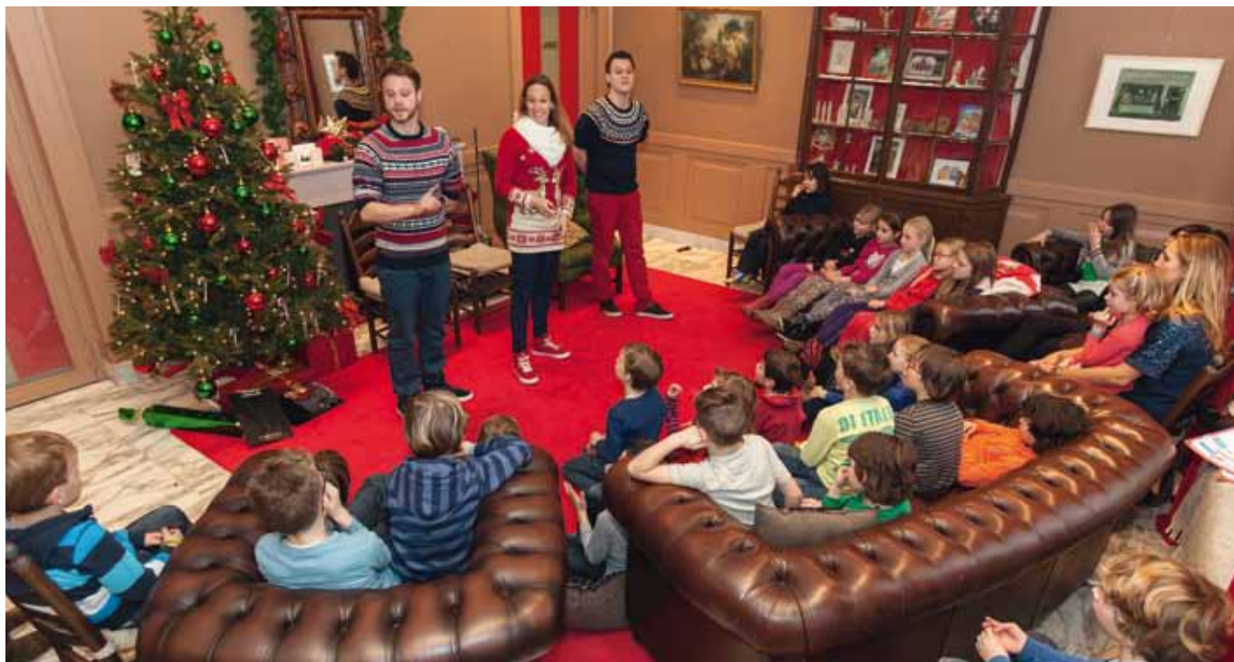
Theatergroep Aluin tijdens Beleef het kerstverhaal

Ook op Twitter en Facebook wordt de collectie geregeld in beeld gebracht door een object uit te lichten in een vast terugkerende rubriek, getiteld 'Even voorstellen'.