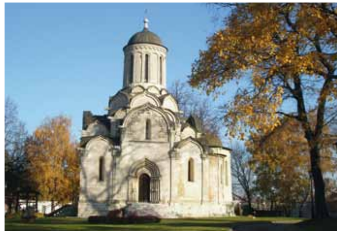
Het Andrej Rublev Museum is gevestigd op het terrein van het Andronikovklooster, een van de oudste kloosters van Moskou