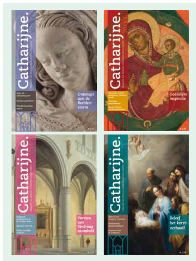
Covers van de Catharijne

De Vereniging Vrienden van Museum Catharijneconvent is een uniek platform voor mensen die het museum willen ondersteunen. Met hun bijdrage helpen ze de collectie te bewaren, te behouden en uit te breiden. Ze krijgen daarvoor speciale privileges zoals gratis toegang tot het museum en de lunchlezingen die worden georganiseerd rond een onderwerp dat wordt belicht op een van de lopende tentoonstellingen. Daarnaast ontvangen ze drie keer per jaar het museummagazine Catharijne . Conservatoren en andere deskundigen publiceren achtergrondartikelen over collectie en tentoonstellingen. Er is ook informatie te vinden over de vele activiteiten die voor de leden worden georganiseerd.