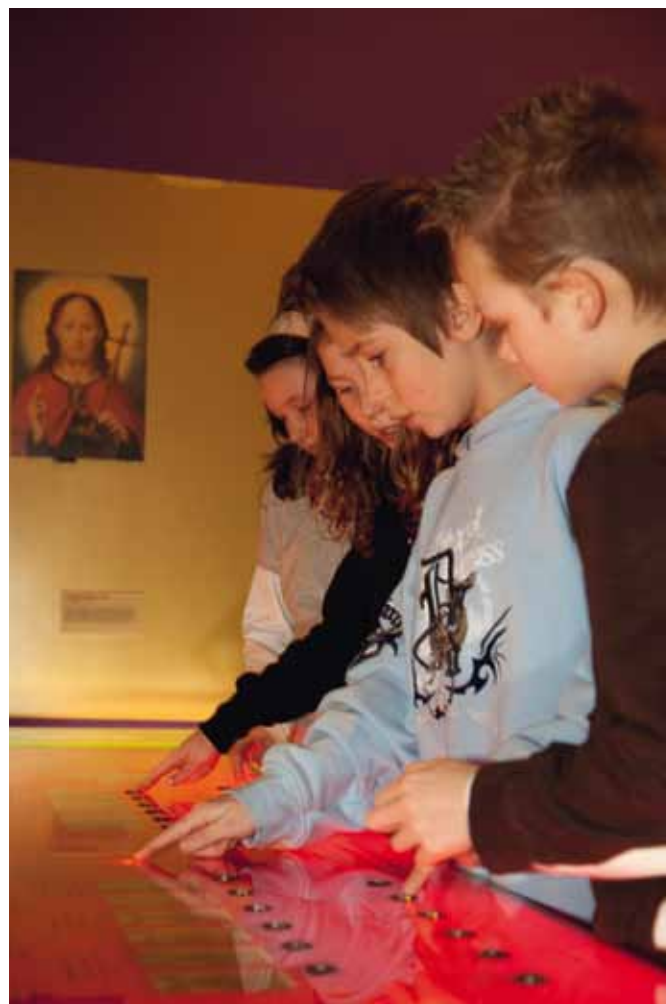
Schoolkinderen op Feest! Weet wat je viert

Naast educatie in schoolverband werken we samen met de Utrechtse Musea ten behoeve van educatieve projecten voor ouderen. Ook in 2013 bezochten bewoners van verzorgings-