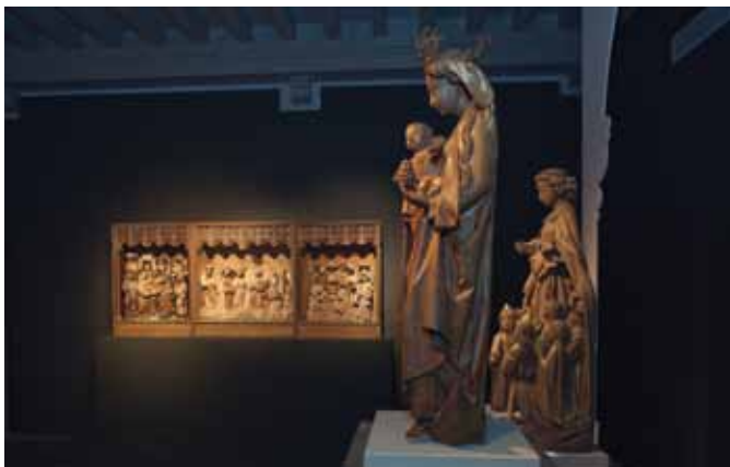
Retabel van Saint-Lambert met voorstellingen uit het leven van Maria uit Musée de Cluny op de tentoonstelling Ontsnapt aan de Beeldenstorm