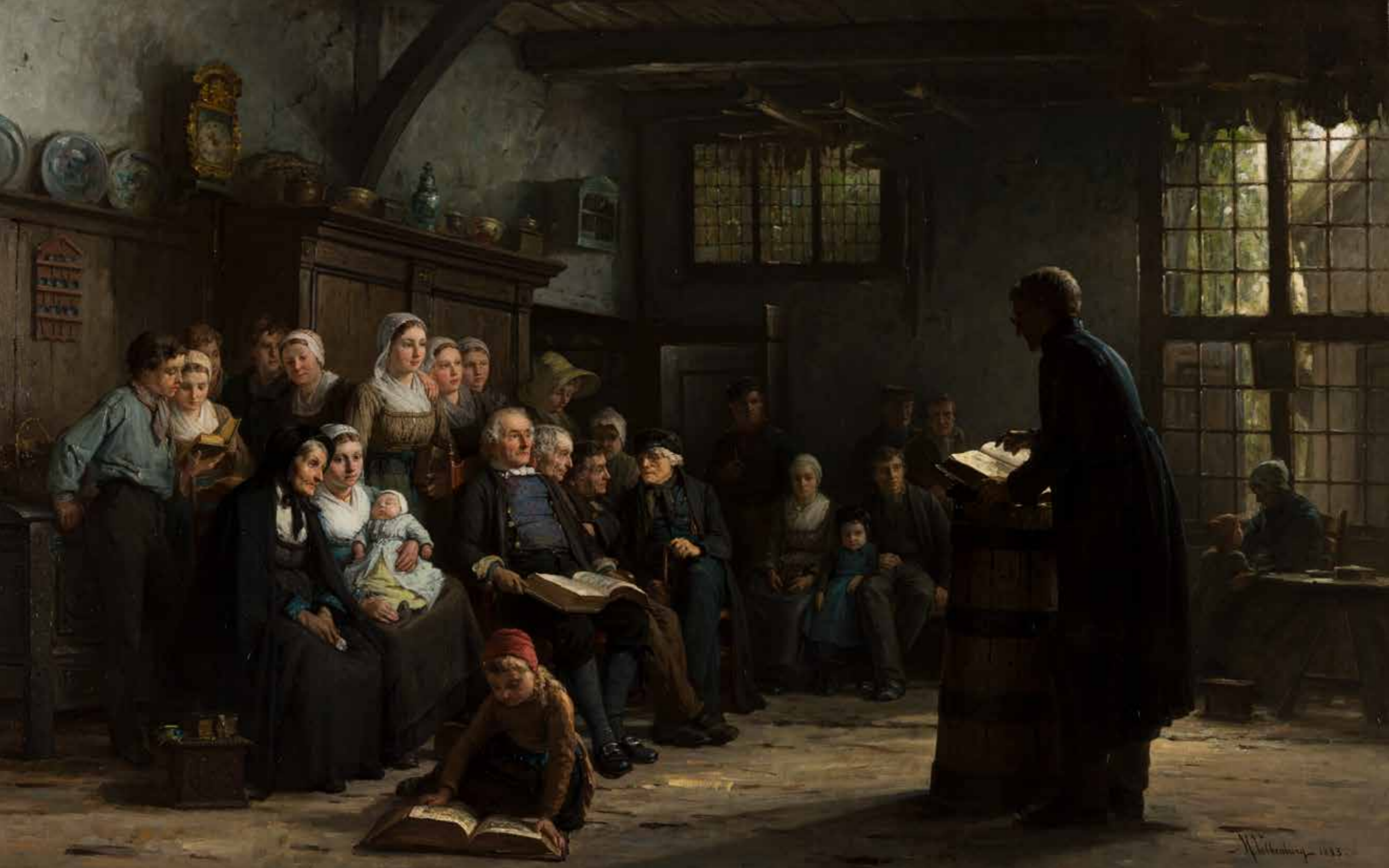
Stichtelijk uurtje in de Achterhoek, Hendrik Valkenburg, 1883 Museum Catharijneconvent