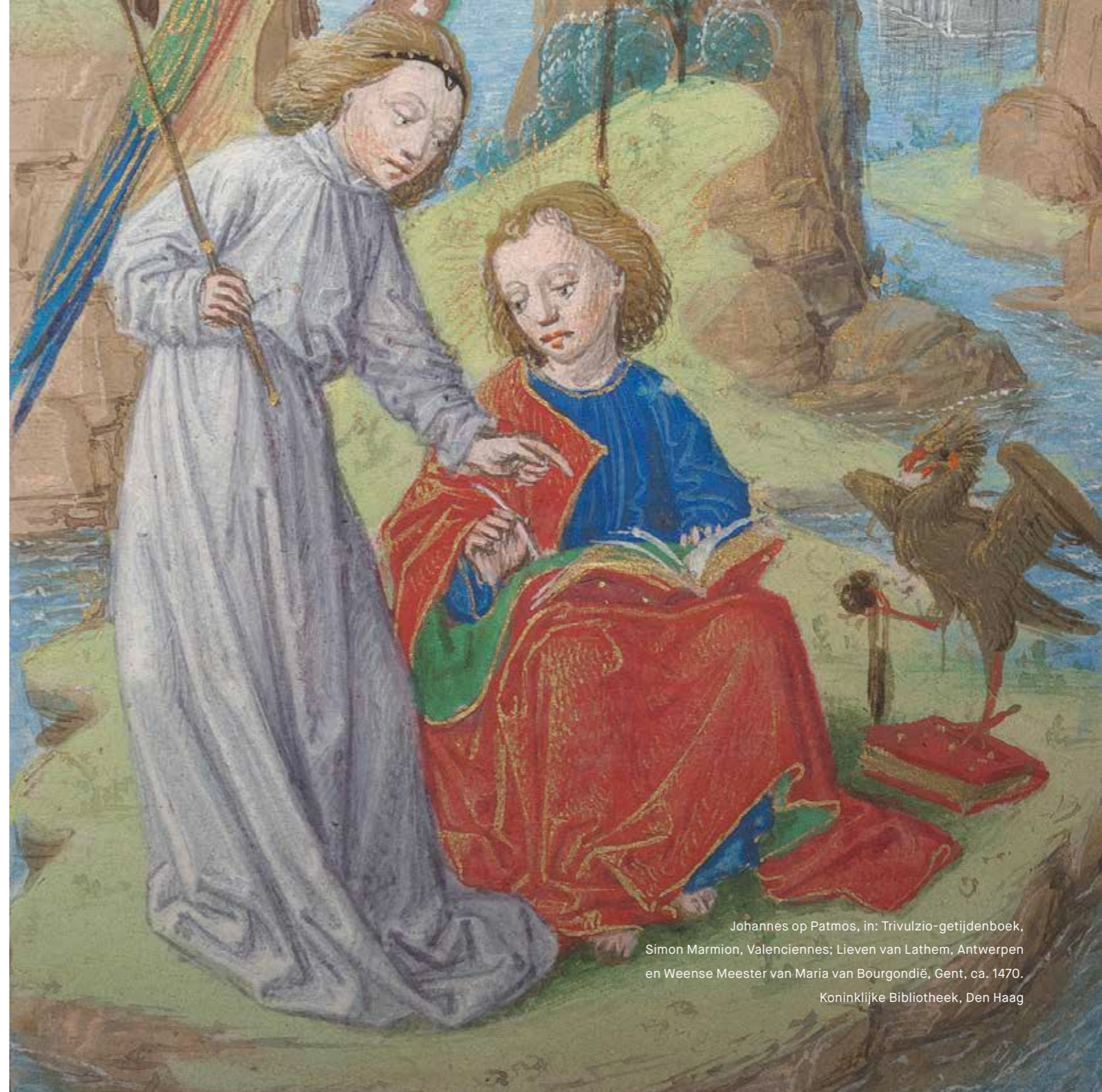
Johannes op Patmos, in: Trivulzio-ge tijdenboek, Simon Marmion, Valenciennes; Lieven van Lathem, Antwerpen en Weense Meester van Maria van Bourgondië, Gent, ca. 1470. Koninklijke Bibliotheek, Den Haag