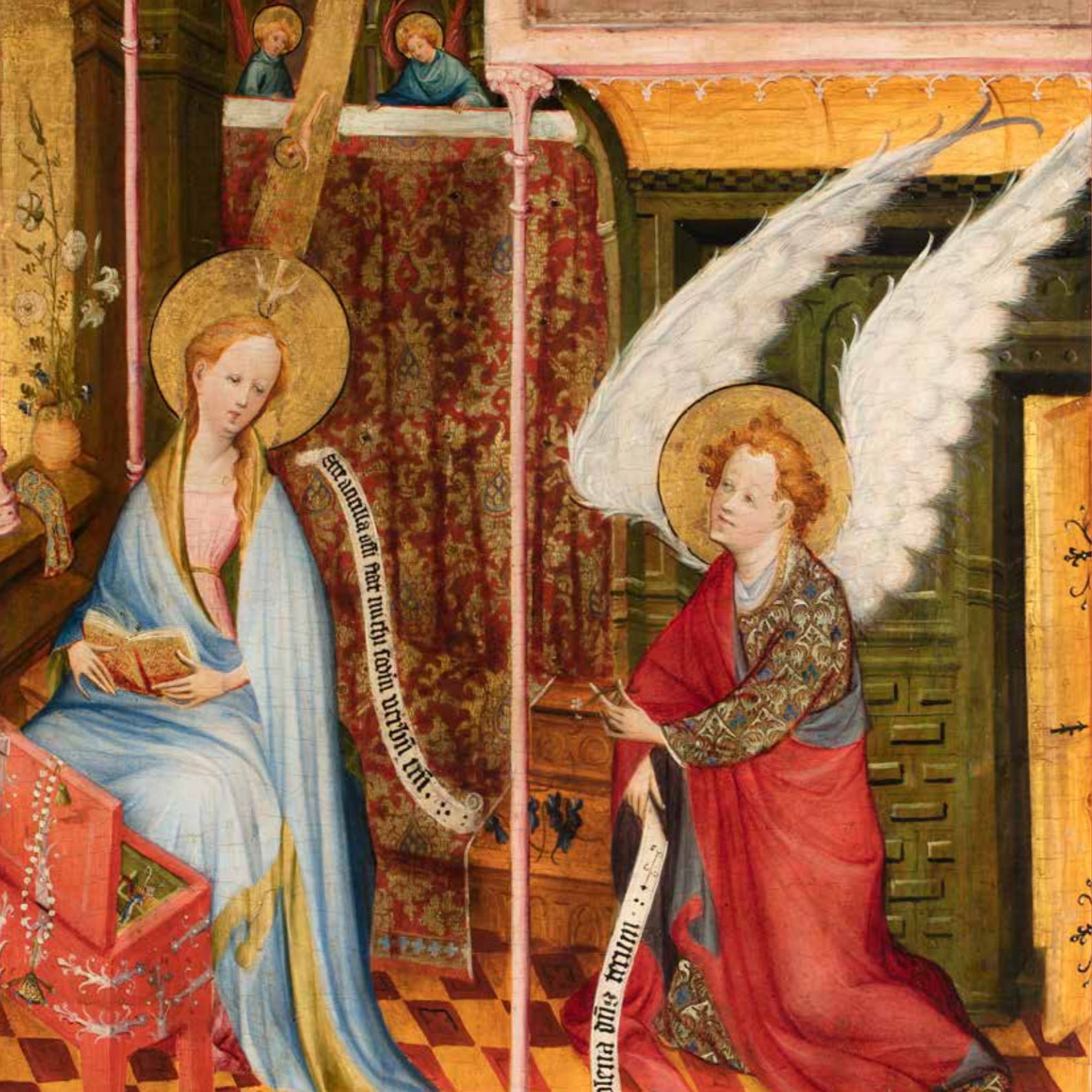
Annunciatie, paneel uit Middelrijns altaar, ca. 1410, Museum Catharijneconvent