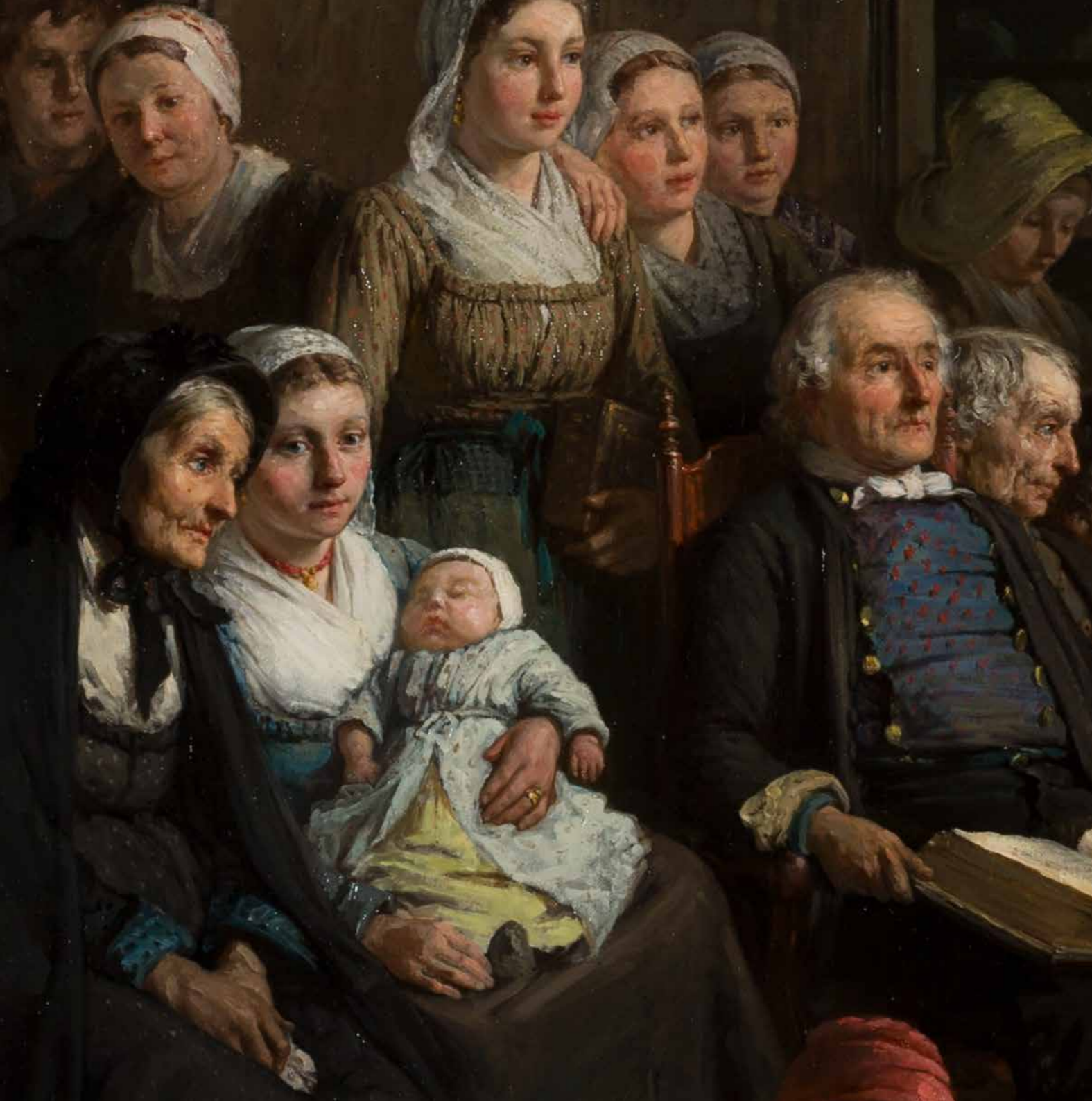
Detail Stichtelijk uurtje in de Achterhoek , Hendrik Valkenburg, 1883, Museum Catharijneconvent

vrouw. Voor Museum Catharijneconvent is deze aanwinst een zeer waardevolle toevoeging op de kerncollectie middeleeuwse beeldhouwkunst. Het museum is de Vereniging Vrienden van Museum Catharijneconvent zeer dankbaar voor het mede mogelijk maken van deze aankoop.