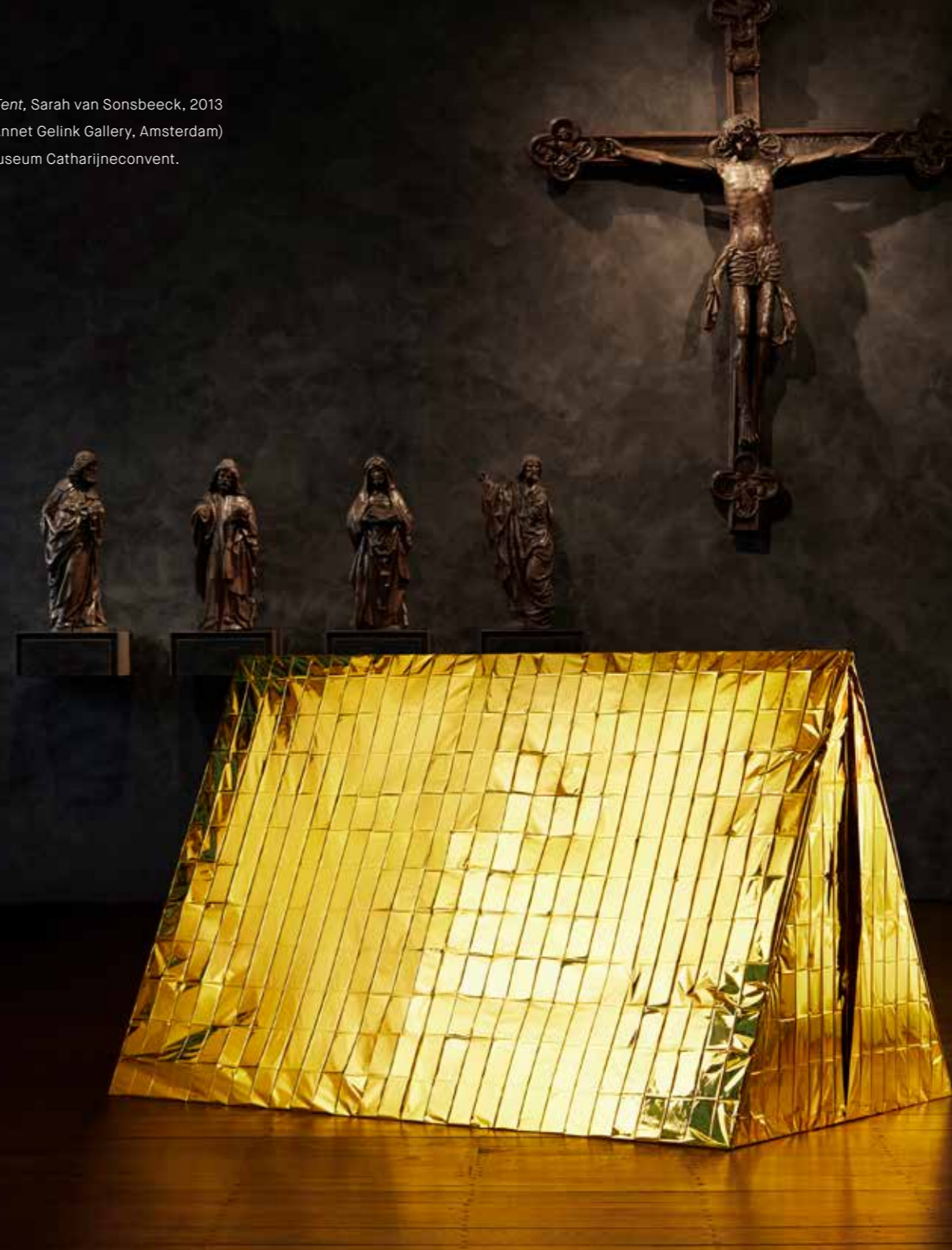
Anti Drone Tent , Sarah van Sonsbeeck, 2013 in Refter Museum Catharijneconvent.

Het landelijke educatieproject Feest! is uitgebreid met twee nieuwe locaties: de kerk van Garmerwolde (Groningen, locatie van de Stichting Oude Groninger Kerken) en het Museum voor Religieuze Kunst te Uden. Het Grootste Museum van Nederland opende in juli 2017 haar eerste dertien locaties. In 2018 worden de Nieuwe Bavo (Haarlem, de Munsterkerk (Roermond) en de Walburgiskerk (Zutphen) toegevoegd aan de al indrukwekkende lijst van topmonumenten.