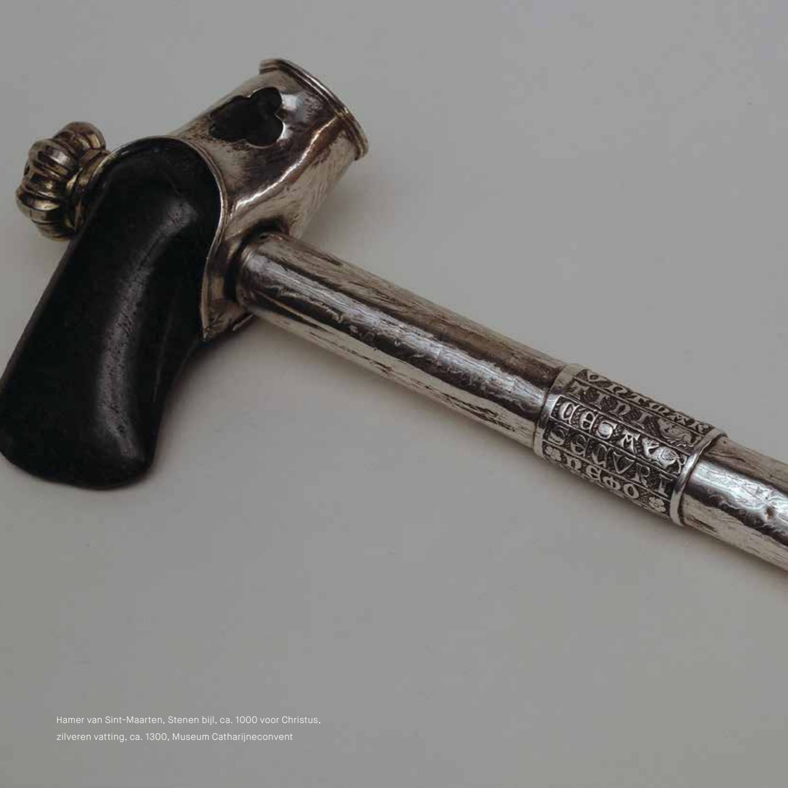
Hamer van Sint-Maarten, Stenen bijl, ca. 1000 voor Christus, zilveren vatting, ca. 1300, Museum Catharijneconvent