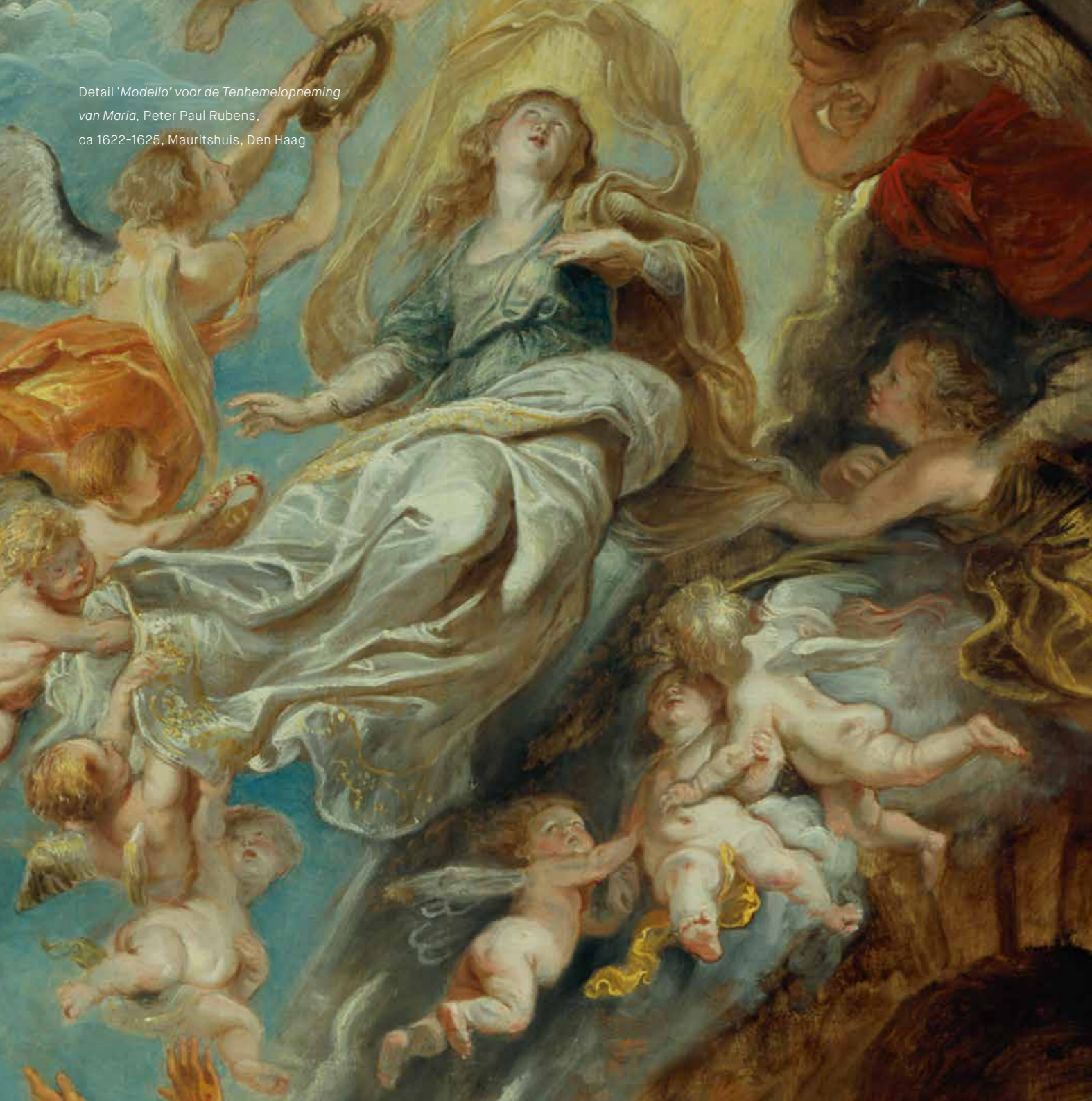
Detail 'Modello' voor de Tenhemelopneming van Maria, Peter Paul Rubens, ca 1622-1625, Mauritshuis, Den Haag