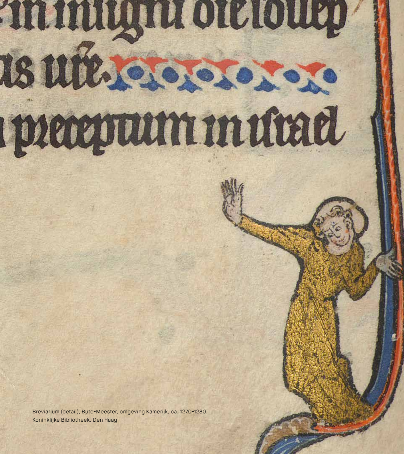
Breviarium (detail), Bute-Meester, omgeving Kamerijk, ca. 1270-1280. Koninklijke Bibliotheek, Den Haag