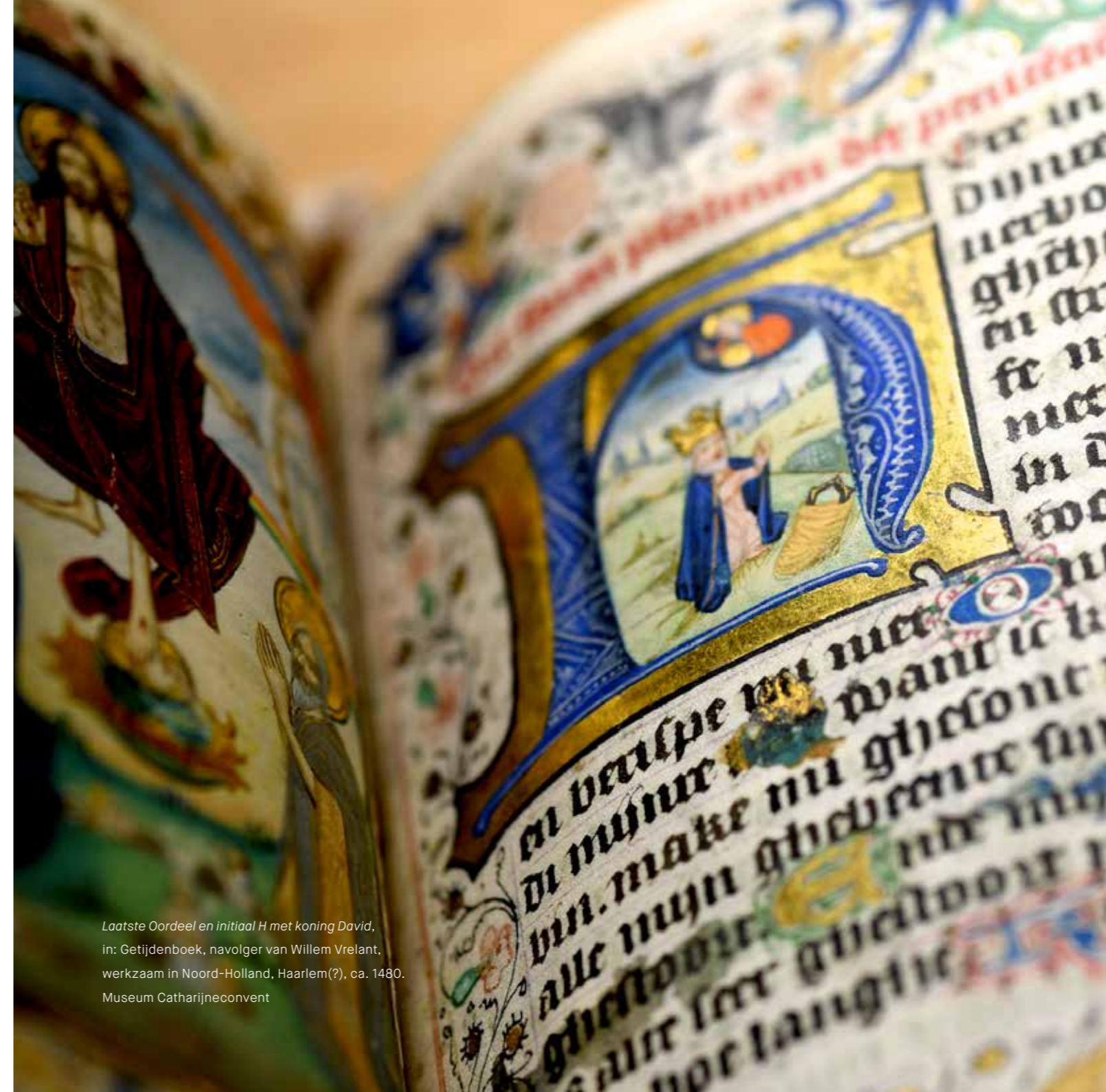
Laatste Oordeel en initiaal H met koning David, in: Getijdenboek , navolger van Willem Vrelant, werkzaam in Noord-Holland, Haarlem(?), ca. 1480. Museum Catharijneconvent

Het museum is in gesprek met het ministerie van OCW, zowel individueel als in samenwerking met de Museumvereniging, over de beschikbare financiële middelen voor het beheer van de collectie. De door het ministerie vastgestelde gelden hiervoor, een bedrag van € 600.000, bieden op geen enkel wijze de mogelijkheid om op langere termijn te kunnen voldoen aan de eisen van de Erfgoedwet. Deze risico's worden tot 2021 gemitigeerd door andere financieringsstromen van OCW. Het museum streeft echter en vanzelfsprekend naar een oplossing voor na 2021.