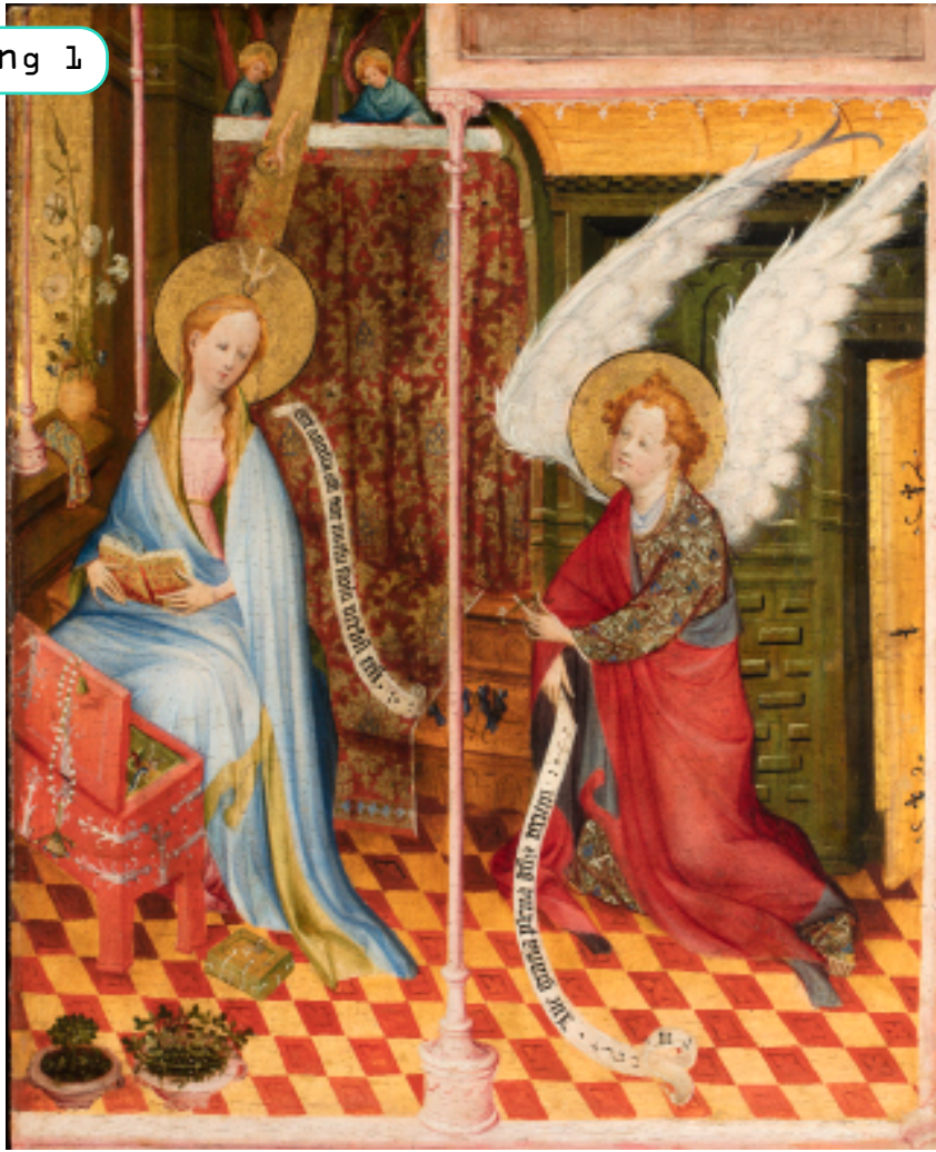
Wonderen rondom een goddelijke baby Middelrjn of Westfalen?, ca. 1410 Utrecht, Museum Catharijneconvent