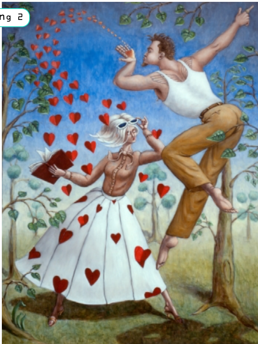
Annunciatie 2001 Frans Franciscus, 2001 RMCC s213