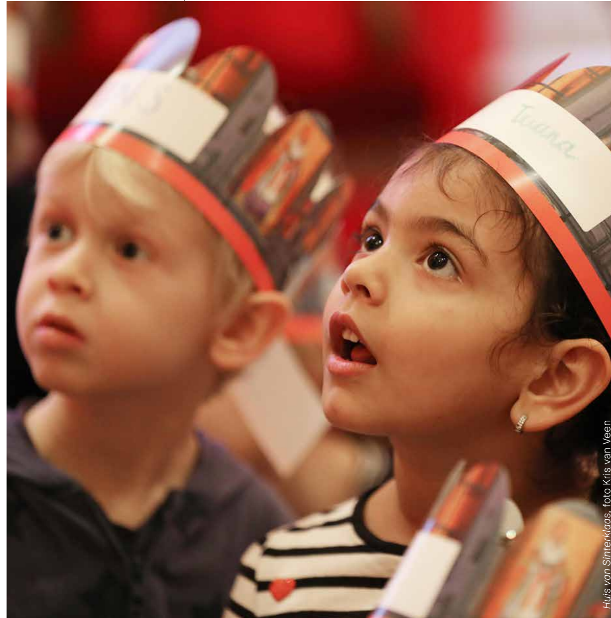
Huis van Sinterklaas

In de komende periode zet het museum deze lijn voort. Bovendien werkt het aan versterking van het 'moedermerk' Museum Catharijneconvent voor het brede publiek en het onderwijs. Zo zullen projecten buiten de muren van het museum altijd in verband worden gebracht met Museum Catharijneconvent. Doel is het museum meer te profileren als een museum dat landelijk opereert, in plaats van een museum in Utrecht dat ook in de rest van Nederland projecten heeft.