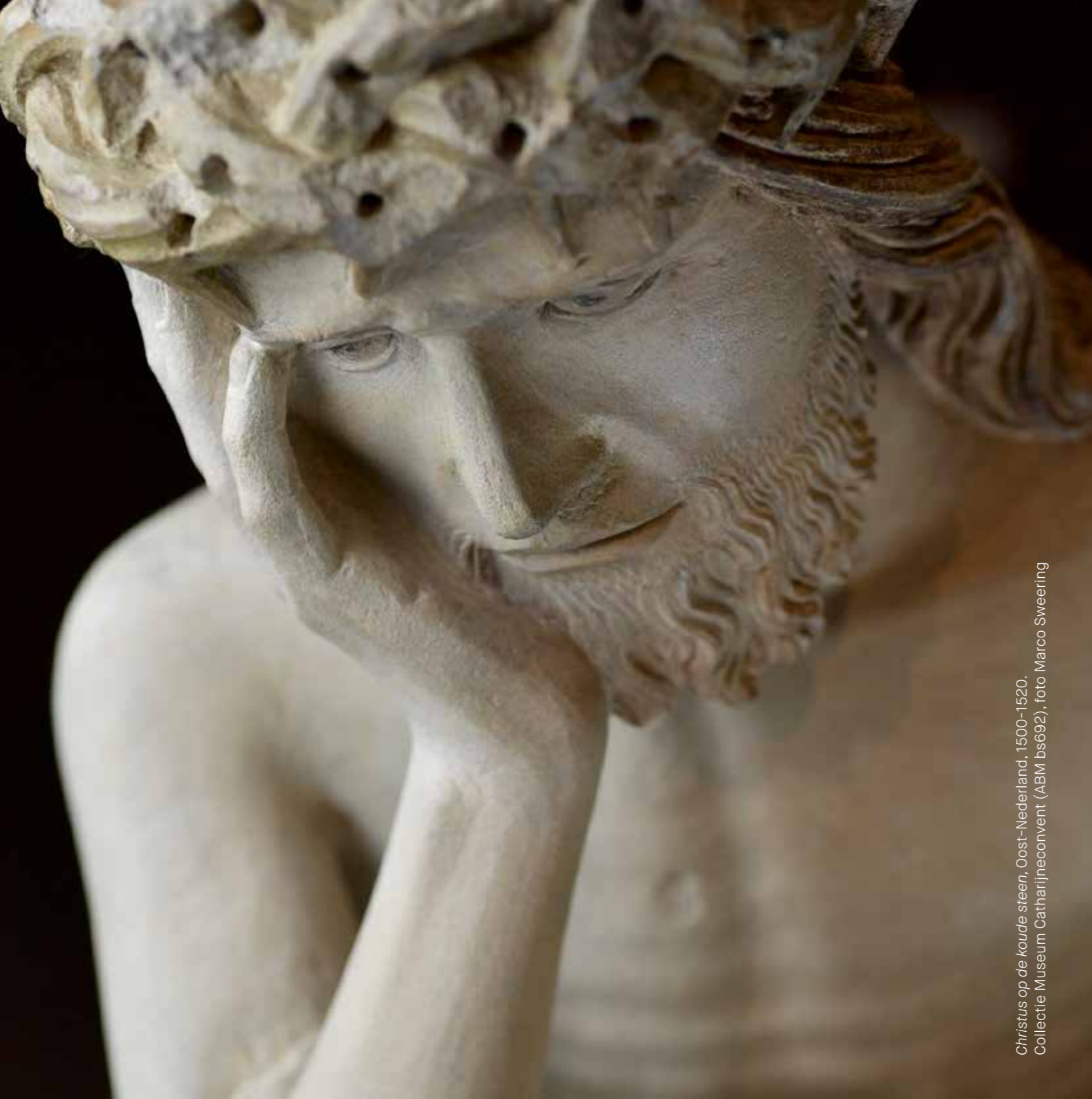
Christus op de koude steen, Oost-Nederland, 1500-1520. Collectie Museum Catharijneconvent (ABM bs692)

Bedrijfsmatig functioneert Museum Catharijneconvent goed: de eigen inkomsten zijn goed, het personeel is kundig en de organisatie kent een platte structuur. Voorwaardelijk is financiering door het ministerie van OCW. Groei van het museum vraagt om een verdere professionalisering van de organisatie.