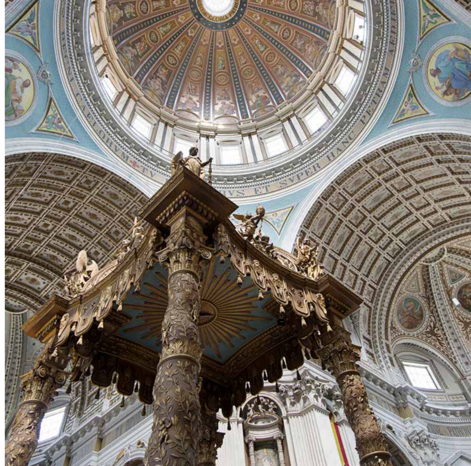
Het Grootste Museum van Nederland, Basiliek van de heiligen Agatha en Barbara, Oudenbosch, foto Arjan Bronkhorst