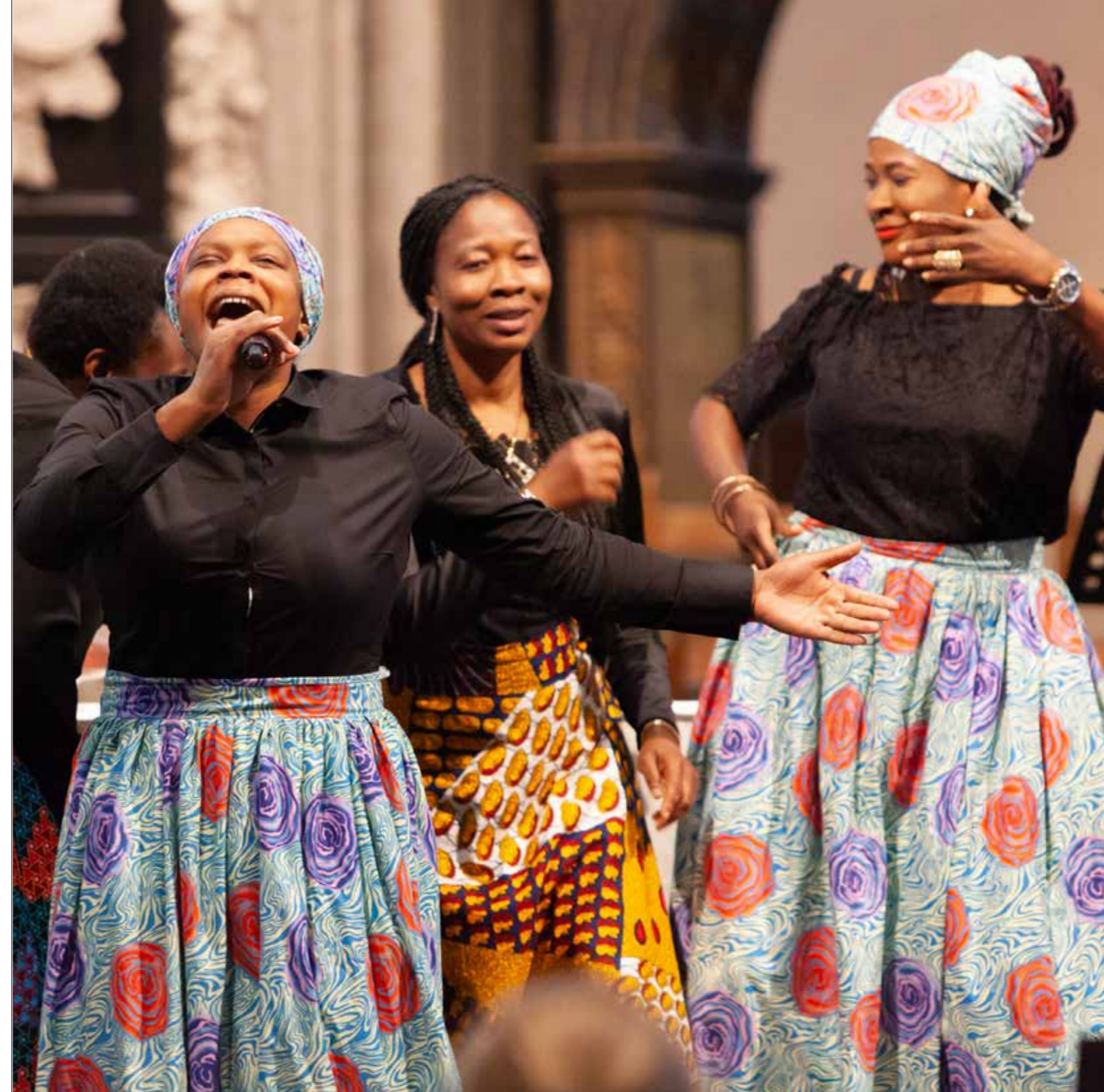
Choir Festival 2019