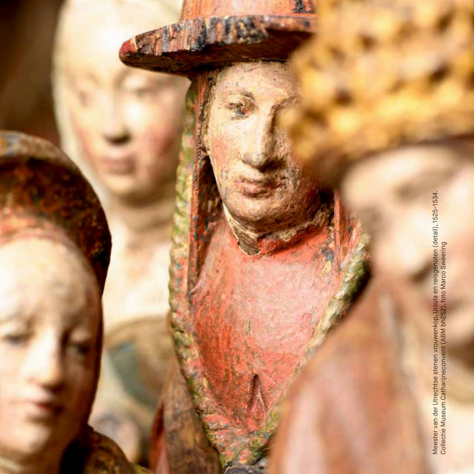
Meester van der Utrechtse stenen vrouwenkop, Ursula en reisgenoten (detail), 1525-1534. Collectie Museum Catharijneconvent (ABM bh252)

Als netwerkmuseum heeft Museum Catharijneconvent een cruciale functie bij kennisuitwisseling. Het participeert in internationale, nationale en lokale samenwerkingsverbanden. Ook de komende periode zal het kennis blijven uitwisselen, onder meer in het kader van het behoud van christelijk erfgoed in situ. Inmiddels heeft het museum een groot netwerk van partners, die vergelijkbare inhoudelijke of ideële drijfveren hebben. Zonder dit fundament is een vruchtbare samenwerking onmogelijk. De verscheidenheid aan partners is groot. Dat is een bewuste keuze, die sterk bijdraagt aan het meerstemmige karakter van projecten.