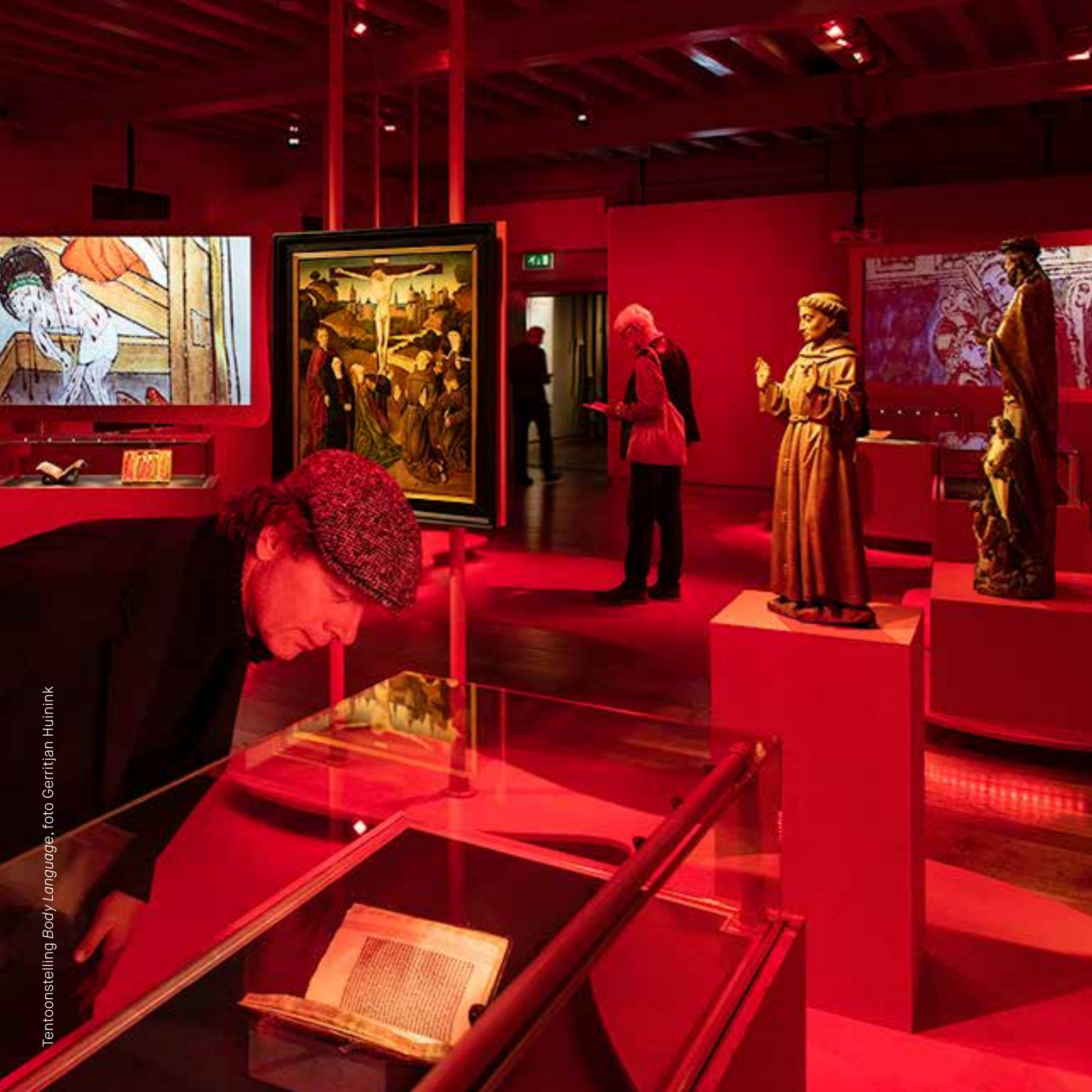
Tentoonstelling Body Language

De beschreven strategie en inhoudelijke basis leiden tot de volgende doelen voor de periode 2021-2024. 2