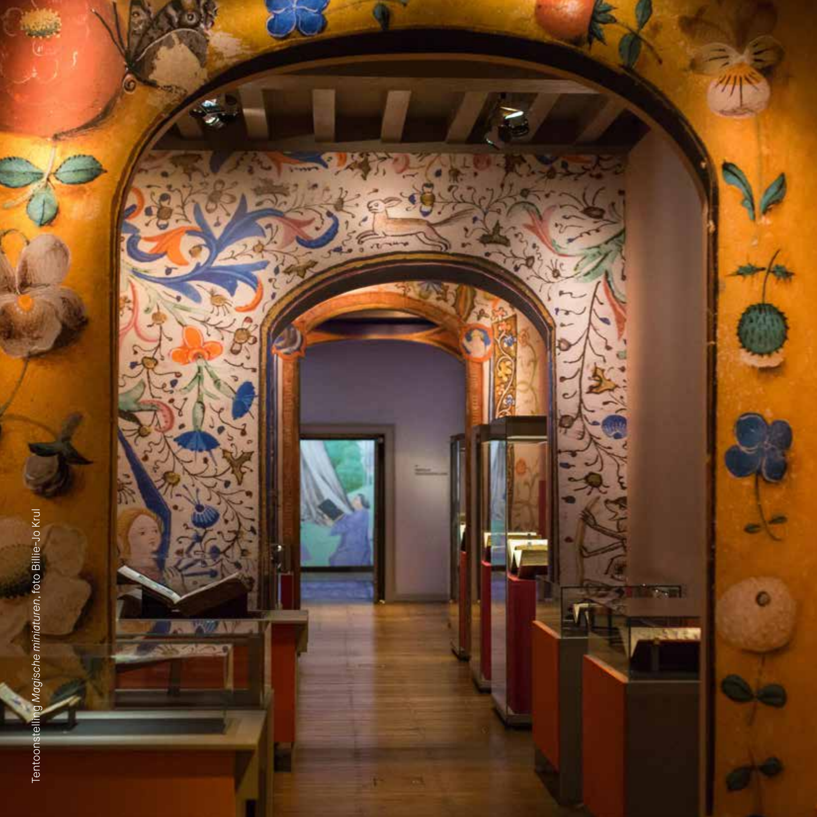
Tentoonstelling Magische miniaturen