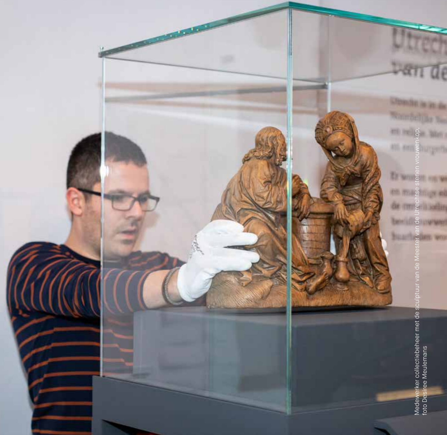
Medewerker collectiebeheer met de sculptuur van de Meester van de Utrechtse stenen vrouwenkop

Ook de komende jaren zet het museum zich in als ontwikkelplaats voor talent. Mede gefinancierd door het Mondriaan Fonds, donateurs en de Van Baaren Stichting investeert het museum in de ontwikkeling en het doorgeven van specialistische kennis op het gebied van het protestantisme en de middeleeuwen. Het museum heeft stageplaatsen voor studenten uit het wetenschappelijk en hoger beroepsonderwijs en werkervaringsplaatsen voor jonge museumprofessionals. Daarbij zoekt het museum naar talenten met specialisaties en culturele achtergronden die nog onvoldoende zijn vertegenwoordigd.