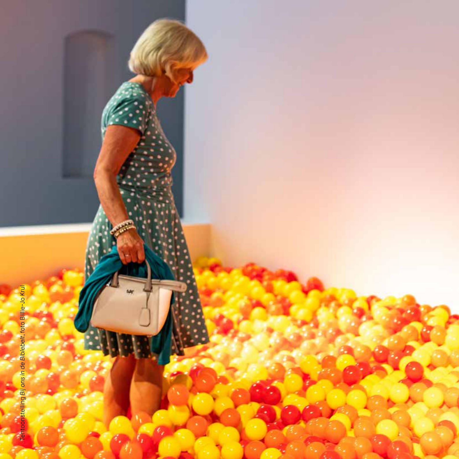
Tentoonstelling Bij ons in de Biblebelt