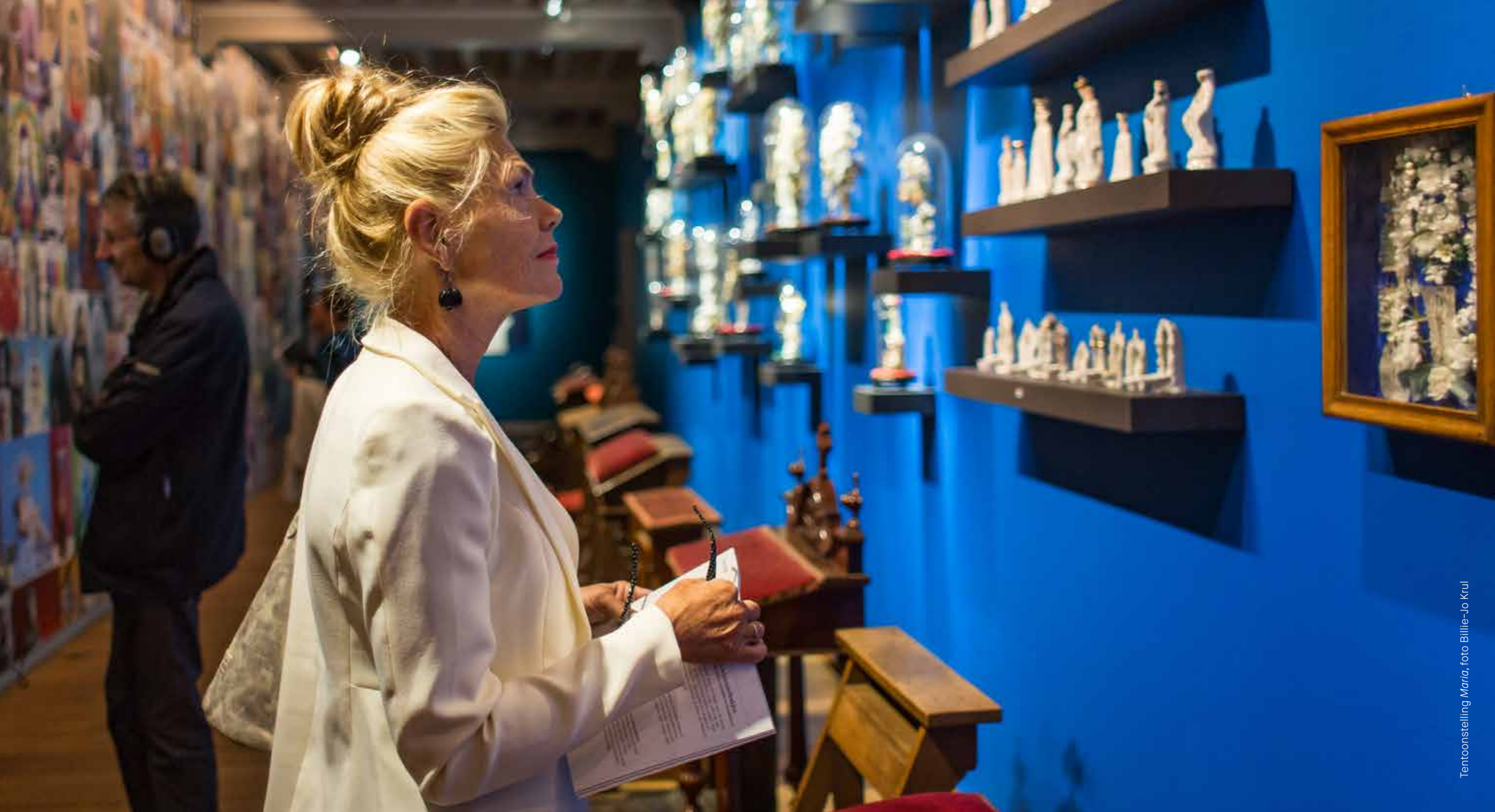
Tentoonstelling Maria