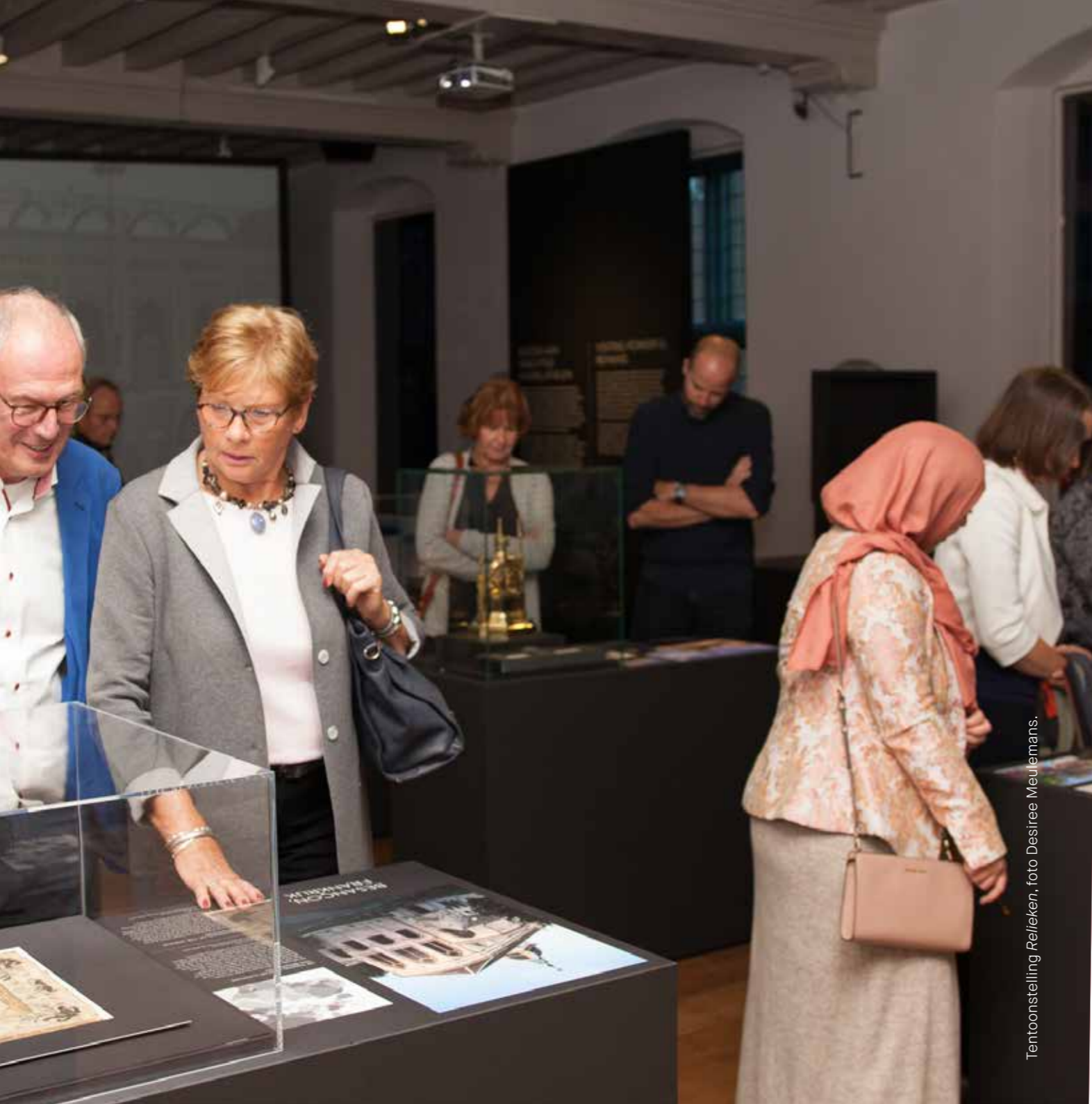
Tentoonstelling Relieken, foto Desiree Meulemans.