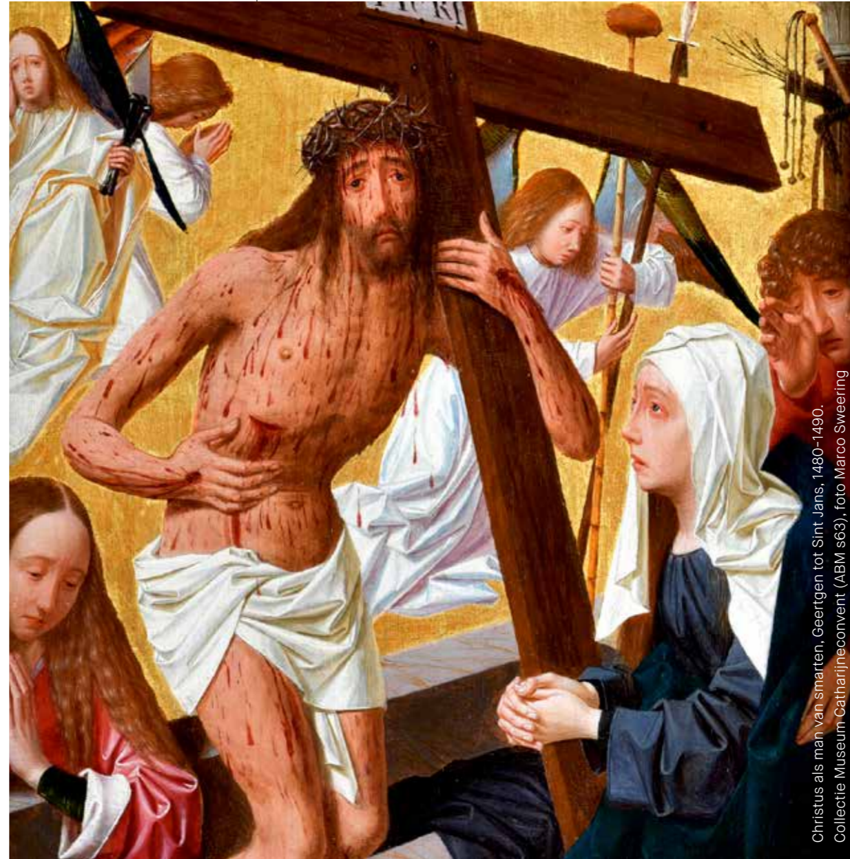
Christus als man van smarten, Geertgen tot Sint Jans, 1480-1490.