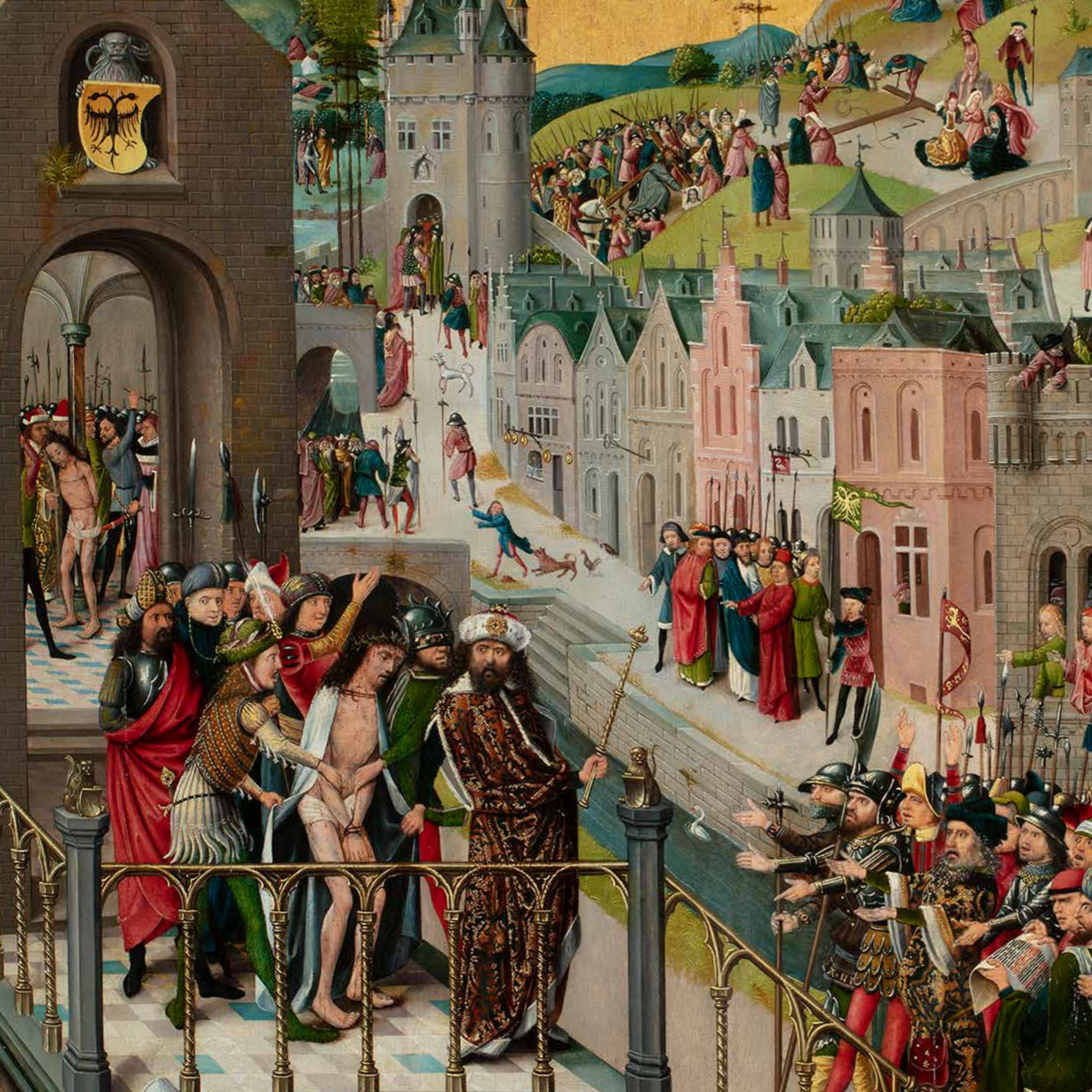
Ecce Homo, taferelen uit het lijden van Christus, Rijnland ca. 1490-1500. Collectie Museum Catharijneconvent (RMCC s375)

Museum Catharijneconvent beheert als rijksmuseum de belangrijkste collectie kunst- en cultuurhistorische objecten van het christendom in Nederland. Dit geeft het museum een nationale en internationale taak, mede vanwege de kunsthistorische waarde van de collectie. Het belang is gelegen in zowel de individuele objecten als de samenhang en breedte van de collectie.