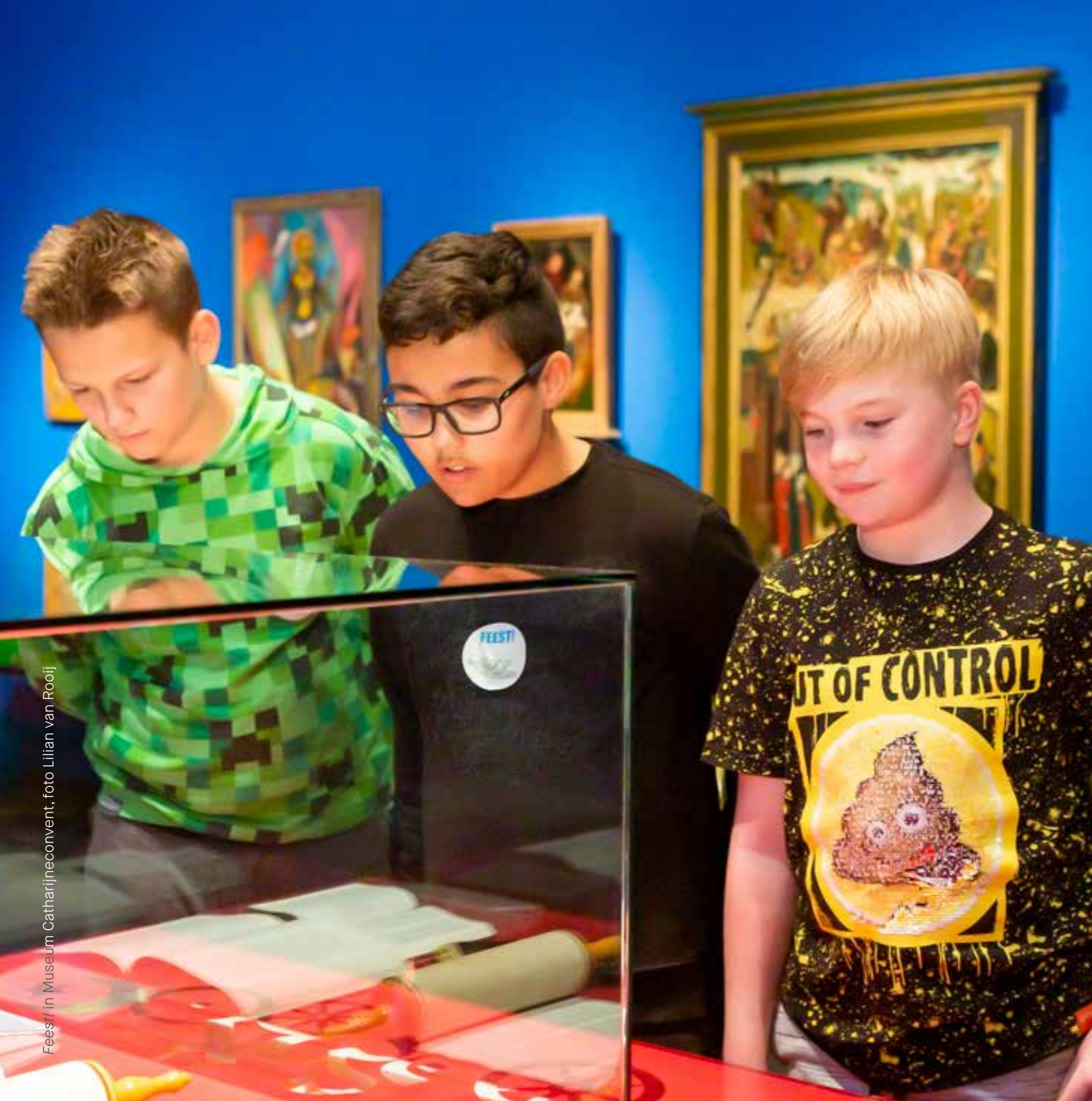
Feest! in Museum Catharijneconvent, foto Lilian van Rooij